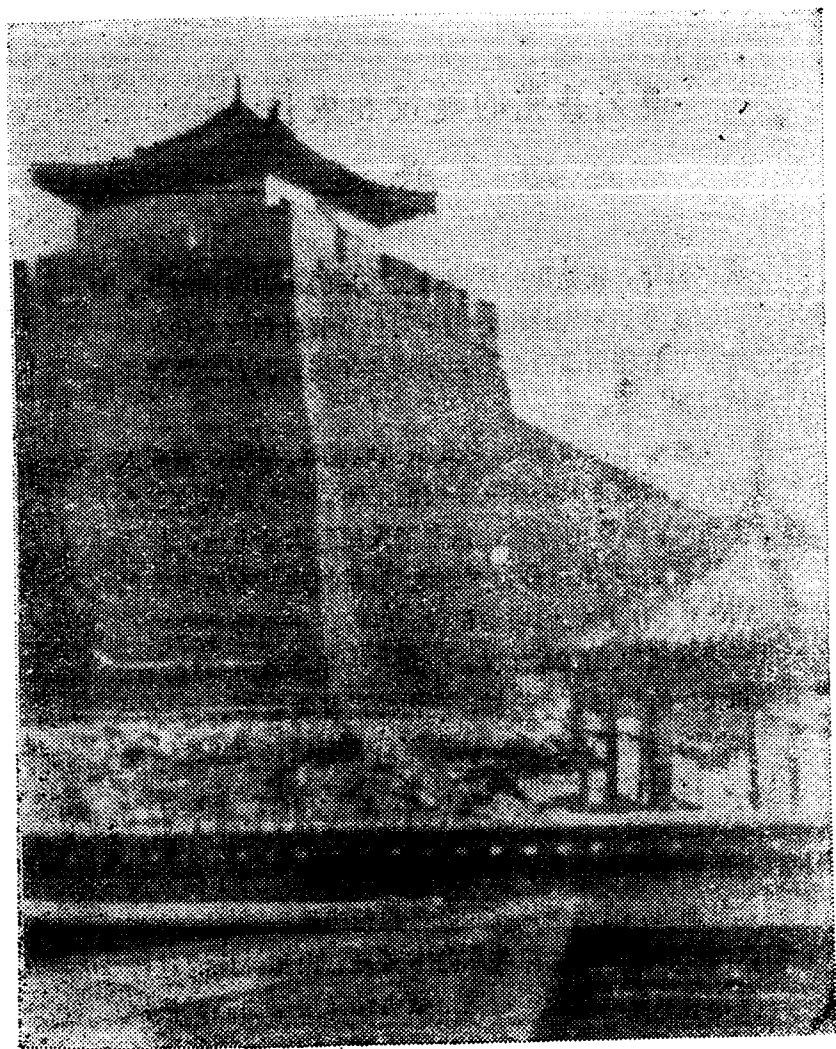
(旧遵化县城东北角楼)