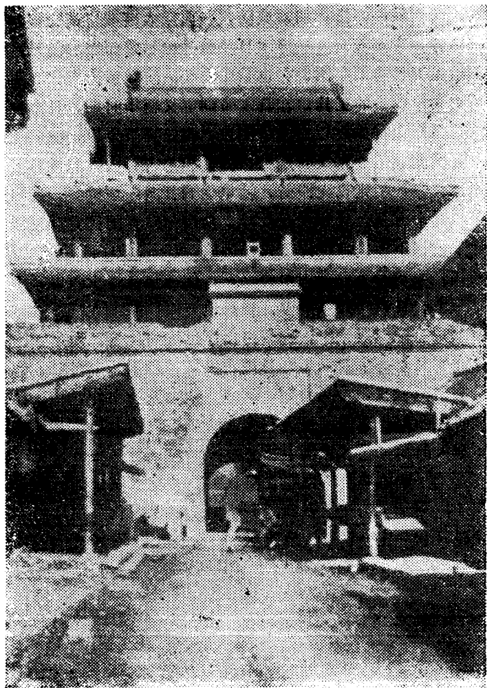
(旧遵化县城北门楼)