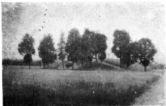
马 武 墓