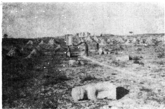
冉 氏 祖 塋