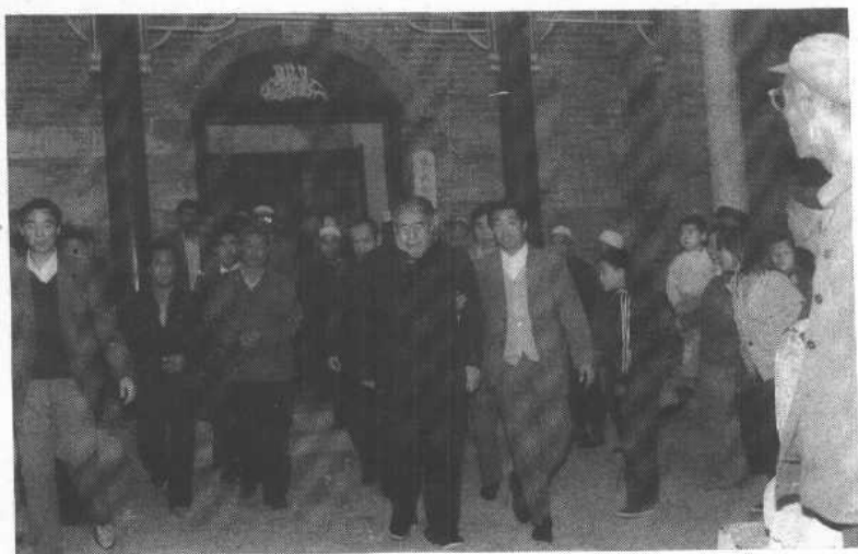
全国政协副主席杨静仁视察金岭镇清真寺