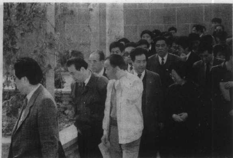
中共中央政治局常委、国务院总理李鹏在临淄区西单村视察