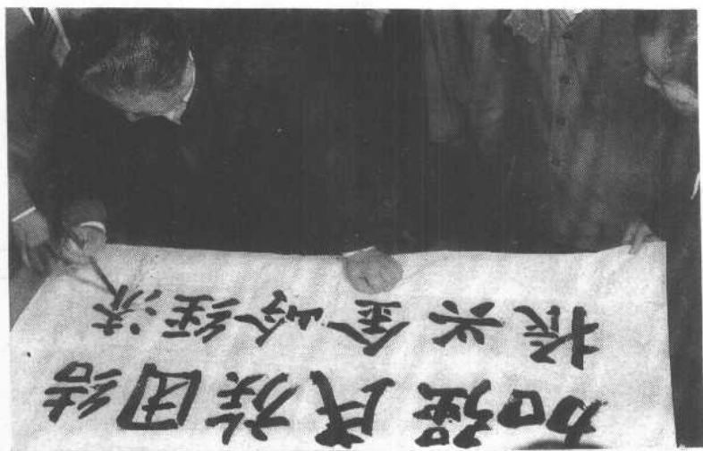
全国政协副主席杨静仁为金岭回族镇题词：加强民族团结，振兴金岭经济。