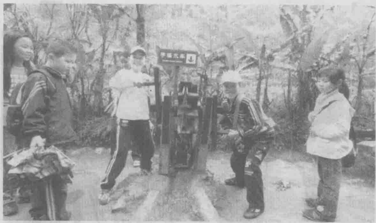
2007年4月1日，百名小记者到车溪春游，度过了愉快的一天。瞧，小记者们玩起这些手摇水车，真是开心极了。