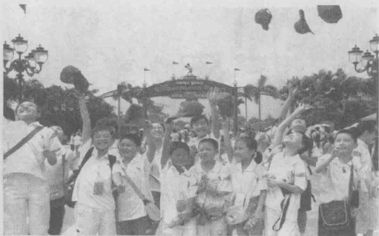
迪斯尼乐园，我们来啦！2007年的香港夏令营，小记者们在迪斯尼乐园里彻彻底底地“疯”了一把。