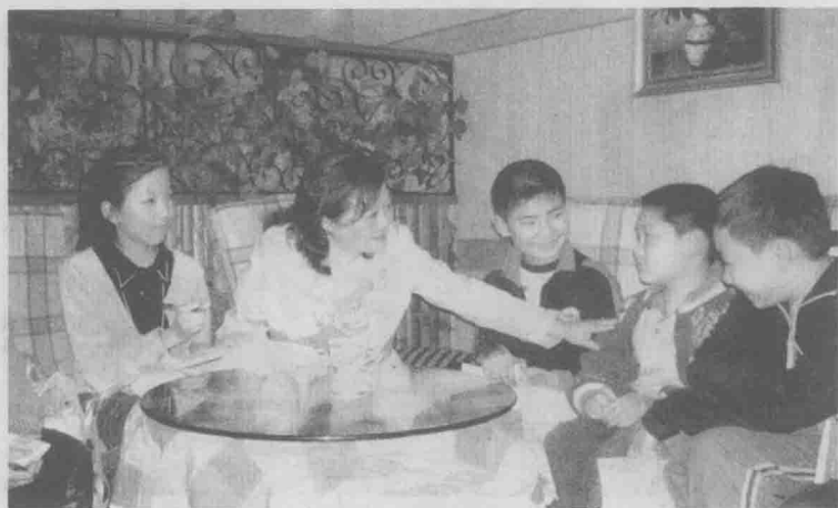
2006年3月26日，著名儿童文学作家杨红樱应邀来到铁路坝新华书店，与众多红樱迷“亲密接触”。数名商报小记者有幸对杨老师进行专访。瞧，杨老师正在亲切地与小记者们交流哩。