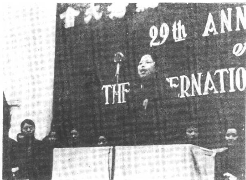
一九三九年三月八日，邓颖超同志代表陕甘宁边区各界妇女在重庆各界妇女纪念“三八”国际劳动妇女节大会上讲话