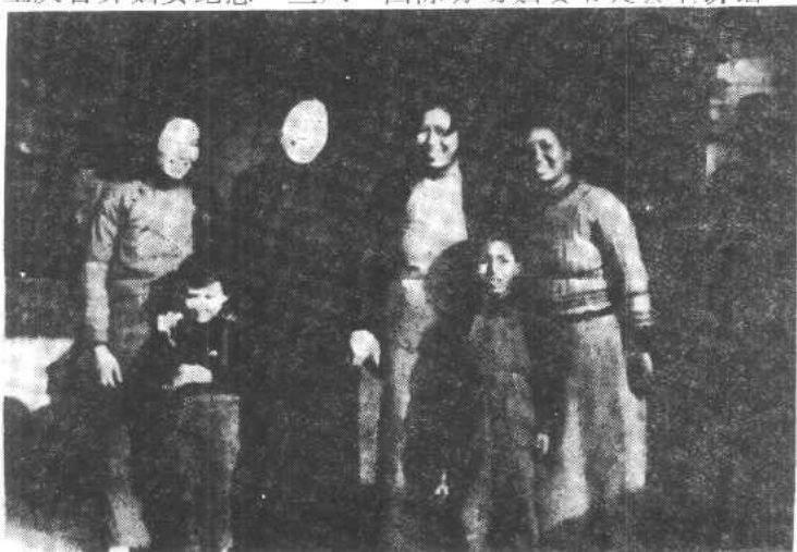
三九年邓颖超、张玉琴、卢竟如、廖似光在重庆机房街合影