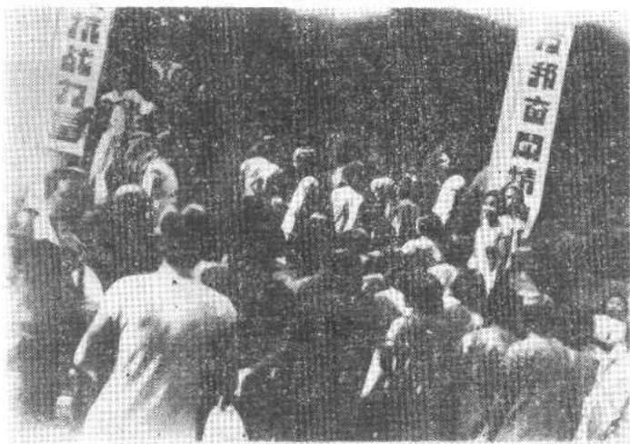
一九四〇年中苏文化协会在重庆中一路一九八号举行苏联妇女生活照片展览