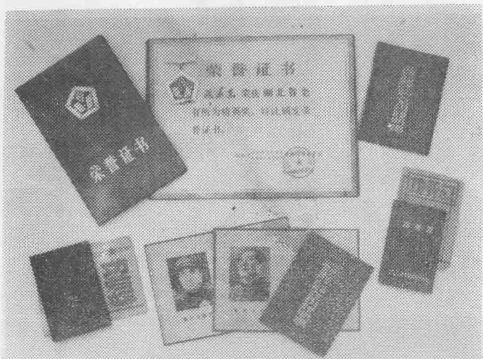
宜昌县离休干部在建设时期获得的部分奖章、纪念章、荣誉证书。需要全本请在线购买： www.ertongt.com