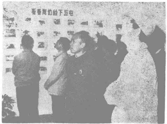
▲ 会议代表参观兴义市下五屯区文化中心站工艺美术室