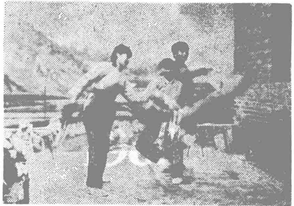
▲ 兴义市下五屯区文化中心站业余文艺队演出的“板凳舞”