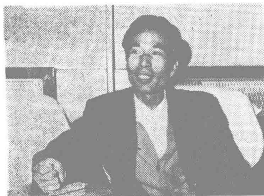
▲ 黔西南州委副书记高发元讲话