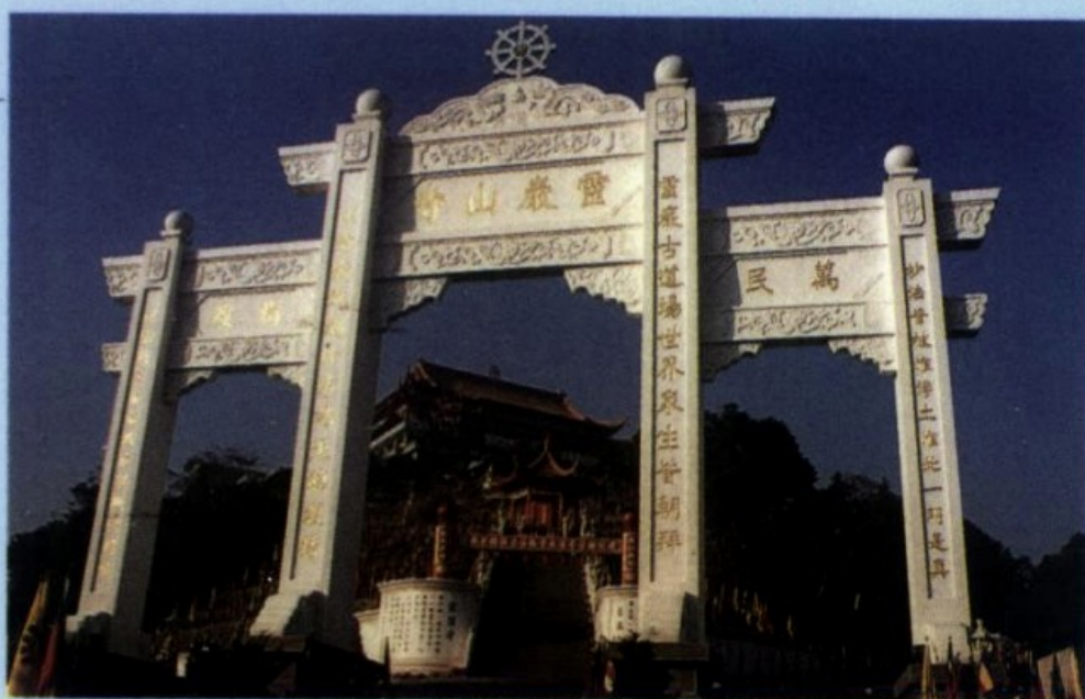
本寺高聳雄壯之山門牌樓