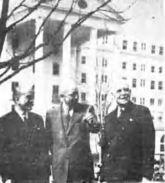
美國政府與美商三昌公司...