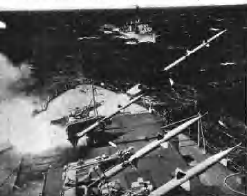
展覽會科發時此會美國科學博覽展示元部