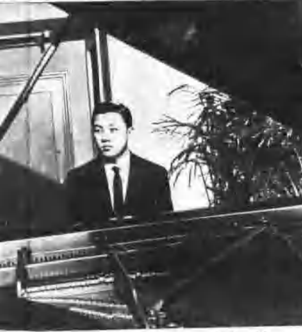
院 附 屬 音 樂 系 學 生 在 演 奏 樂 曲