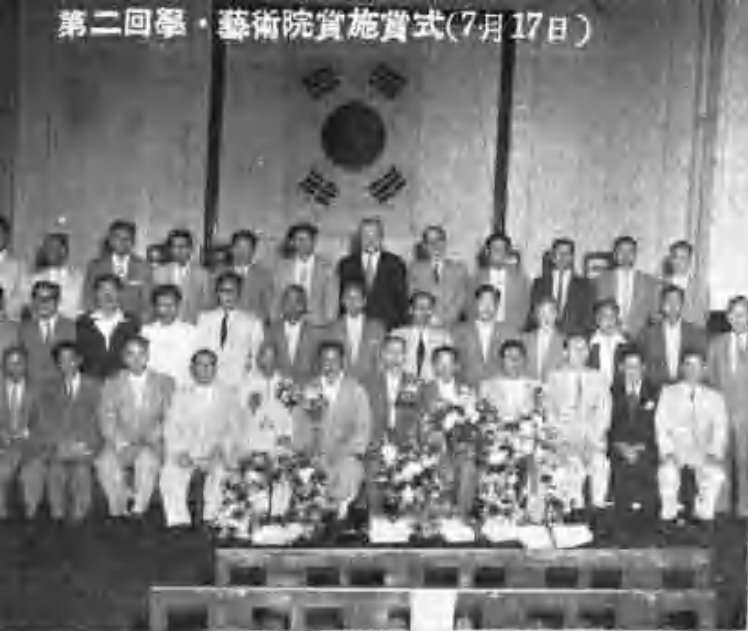
第二回學・藝術院賞施賞式(7月17日)