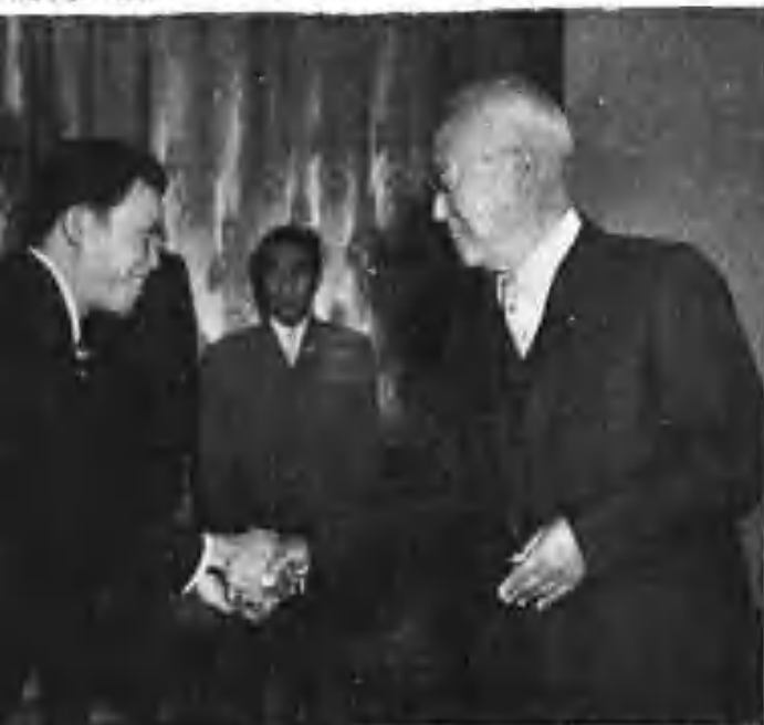
（任越南公使 김·라·익 氏信任状提呈式 6月23日）