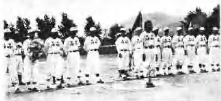
在日橋池學生野球團一行來訪 (8月21日)