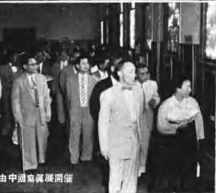
由中國寫真展開催