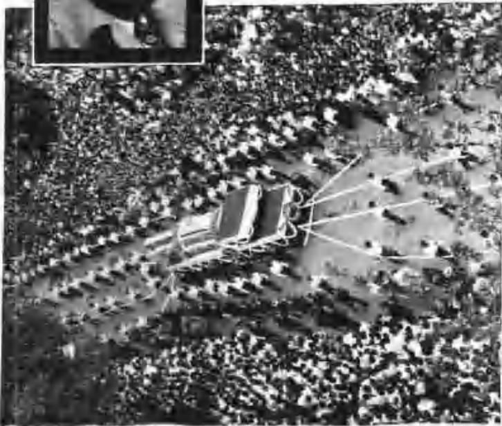
故海公先生國民葬 (5月24日) 五・一七慰勞州民主黨 大總統府前早出濟世社中黨一號卡三十五號慰勞院 濟中發也二號進去 (5月6日)