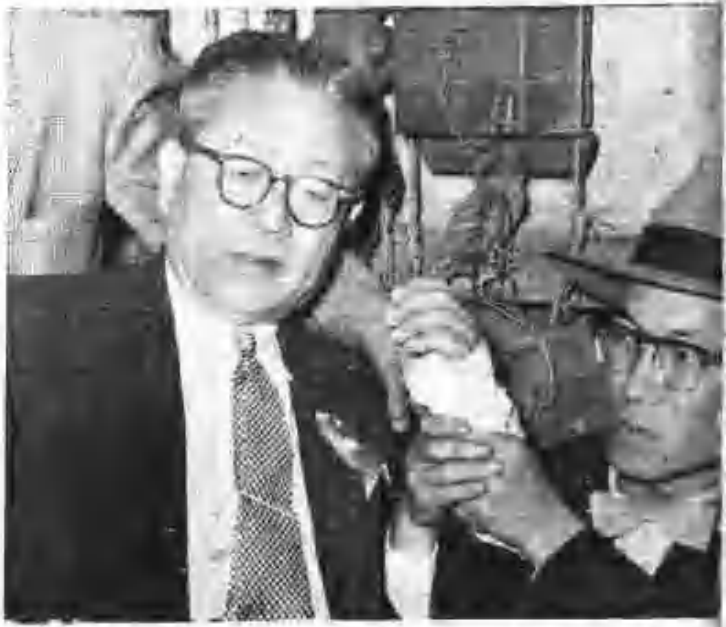
張副統領被擊 (5月28日) 民主黨大會現場 張副統領被擊 (5月28日) 民主黨大會現場