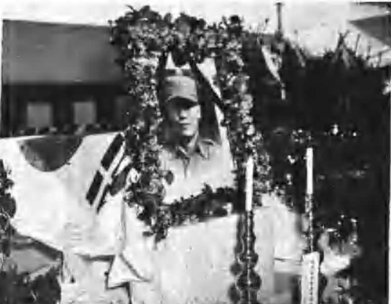
全昌龍中將被擊 前陸軍特務隊長故全昌龍中將 奉現役軍人 ... 奉現役軍人