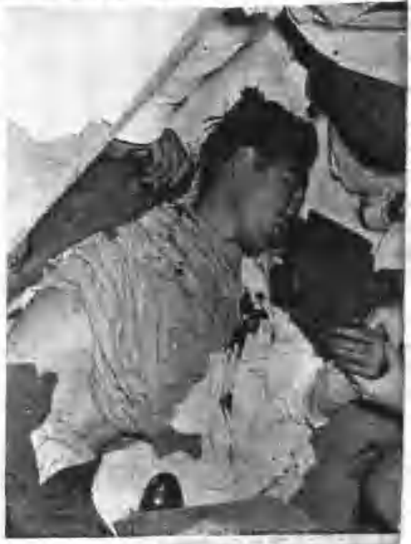
即時現場捕獲張副統領擊犯全相繼