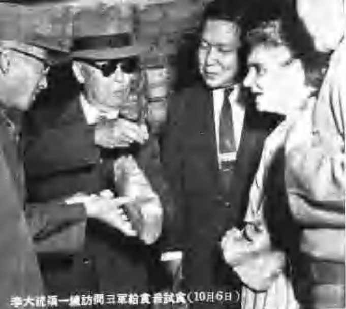
李大統領一應訪問三軍給食會試食(10月6日)