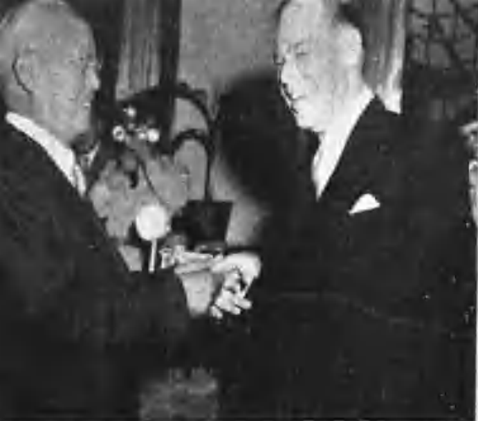
（任美大使 다우린 氏信任状提呈式 7月14日）