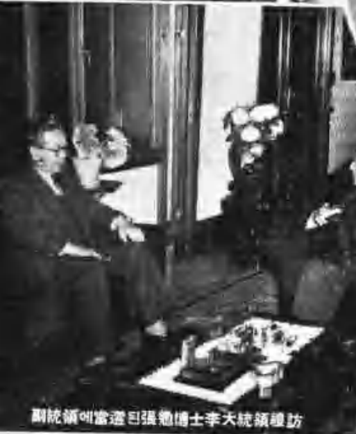
副統領이當選된張勉博士李大統領을 禮訪