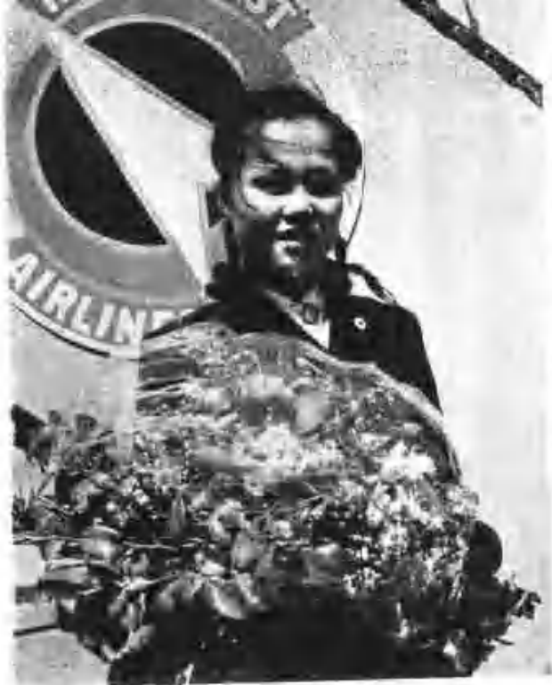
世界第二航空線二十條、各航空線、 陸軍航空隊、歸國兵、慰勞、 四月一日