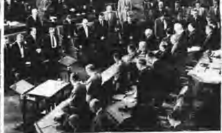
會議會第六四次會法開會