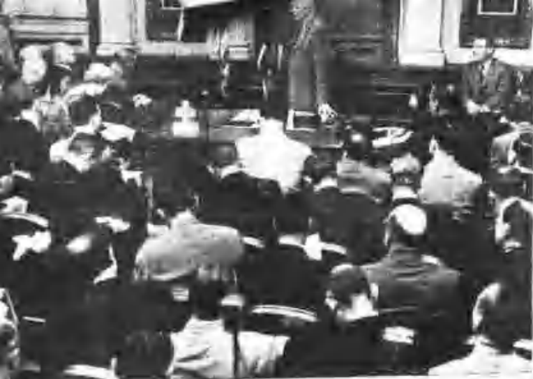
退院後與記者會見席上相對再出再步聲明其 1947年10月21日美大分館