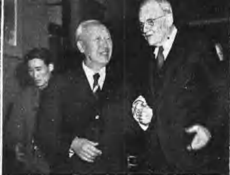
（클레스 美國務長官來韓 8月17日）