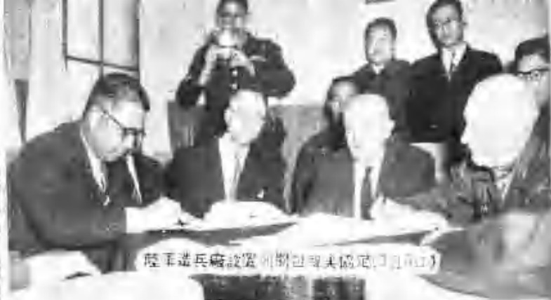
陸軍進兵廠設置(開包與美協定)日(10日)