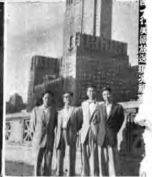
這放送片在國內不在美國放送 現次視察