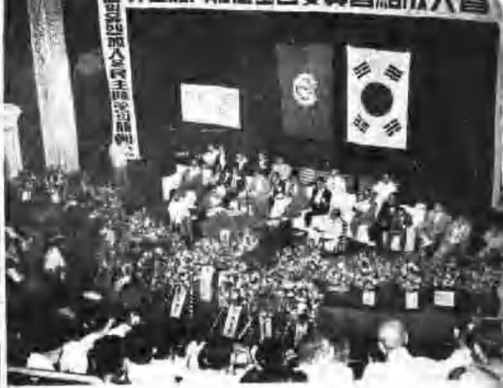
亞細亞反共青年學生大會開幕