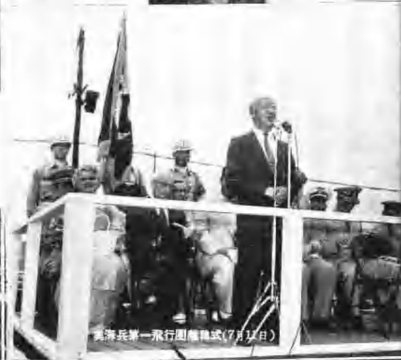
美海兵第一飛行團離韓式(7月12日)