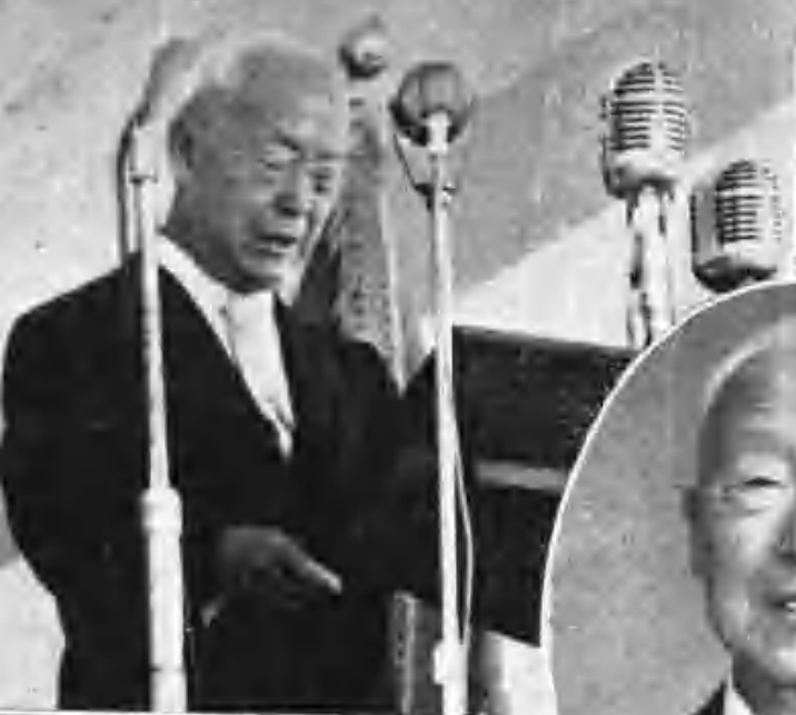
第三代大統領吳第四代副統領就任