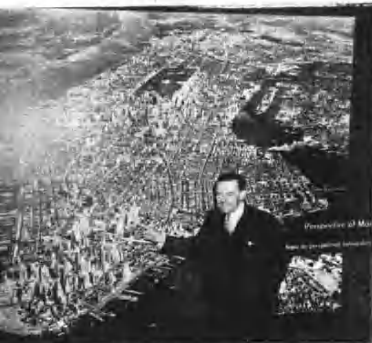
1947年大分館可空中開放全提案西航可能性 德中提案與德空軍提明其1947年10月21日