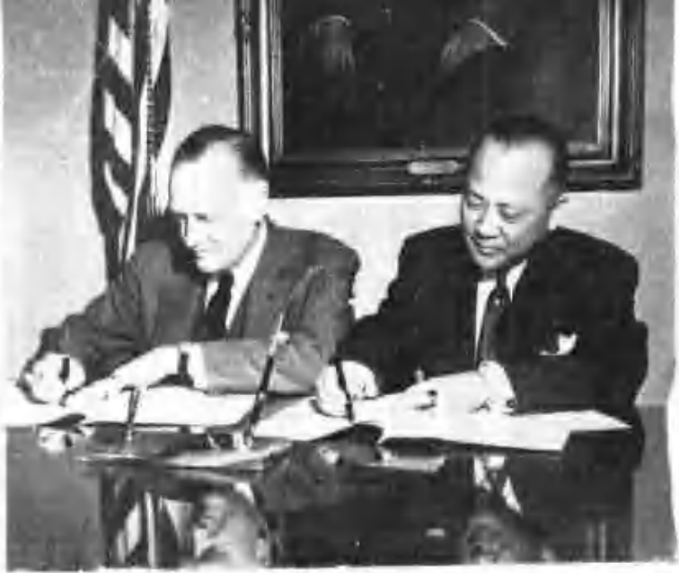
為了美商在華的使用和利益...