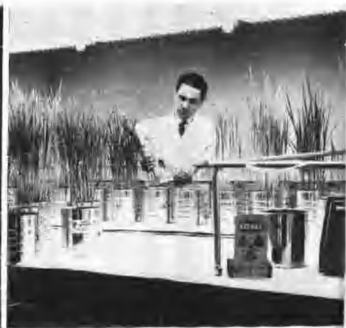
原子力科學業作組