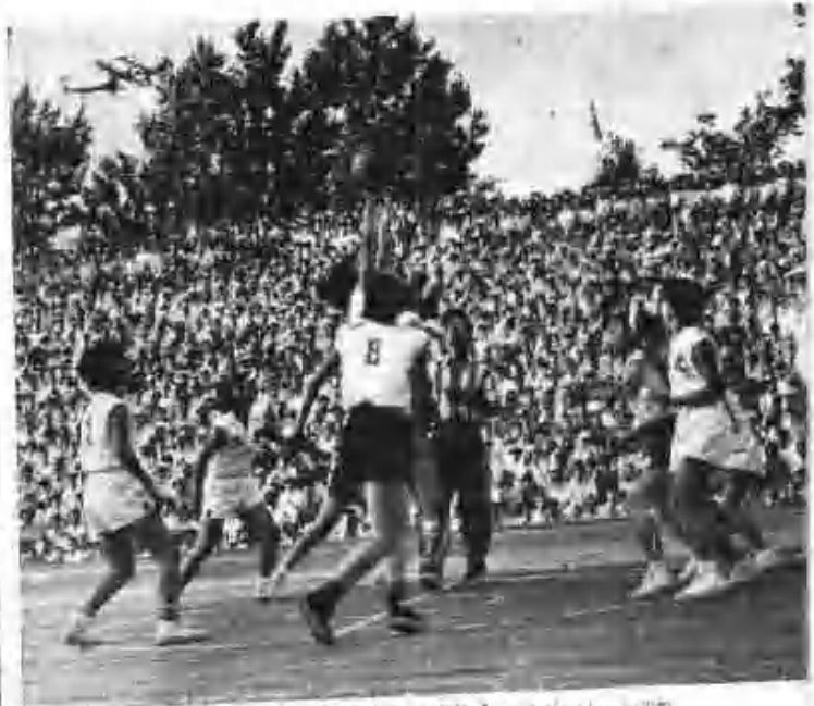
韓中親善籃球試合自由中學 良友會主辦 (6月30日)