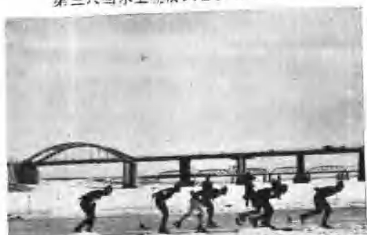
第三六回水上競技大會 (11月30日)