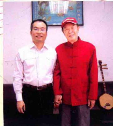
星海音乐学院副院长蔡乔中