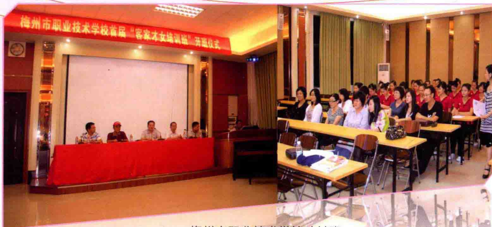
梅州市职业技术学校才女班