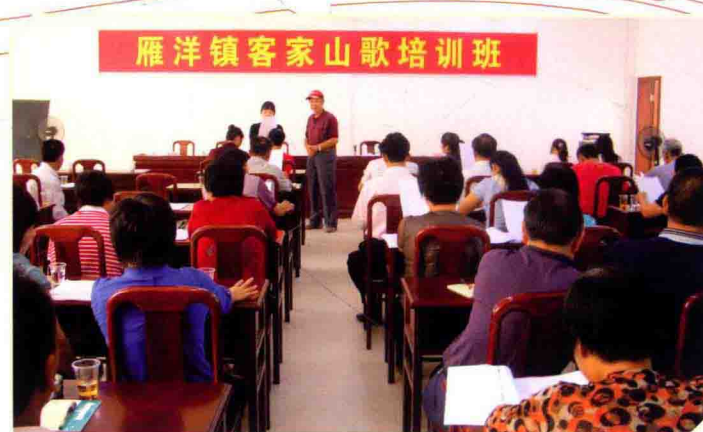
雁洋镇客家山歌培训班