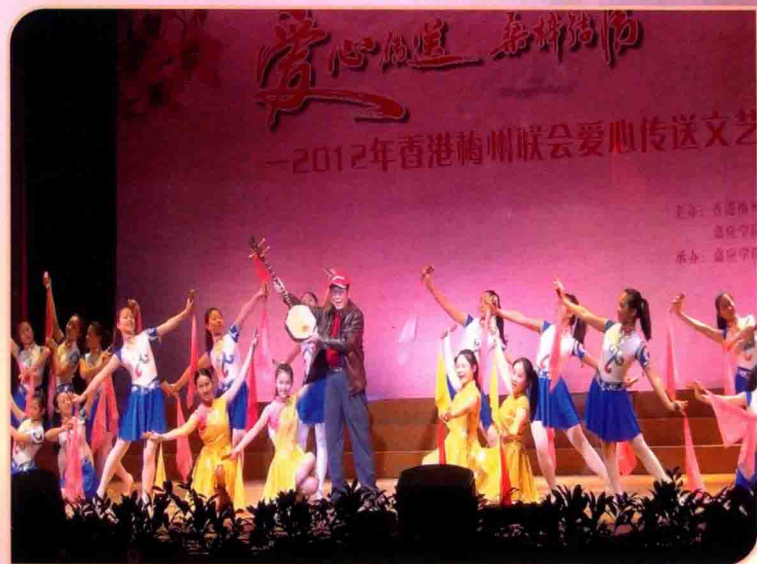
梅州联会爱心晚会节目