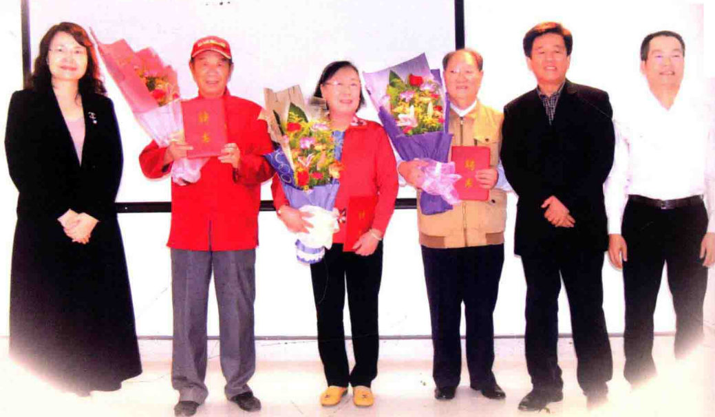
星海音乐学院党委书记李建军（左一）