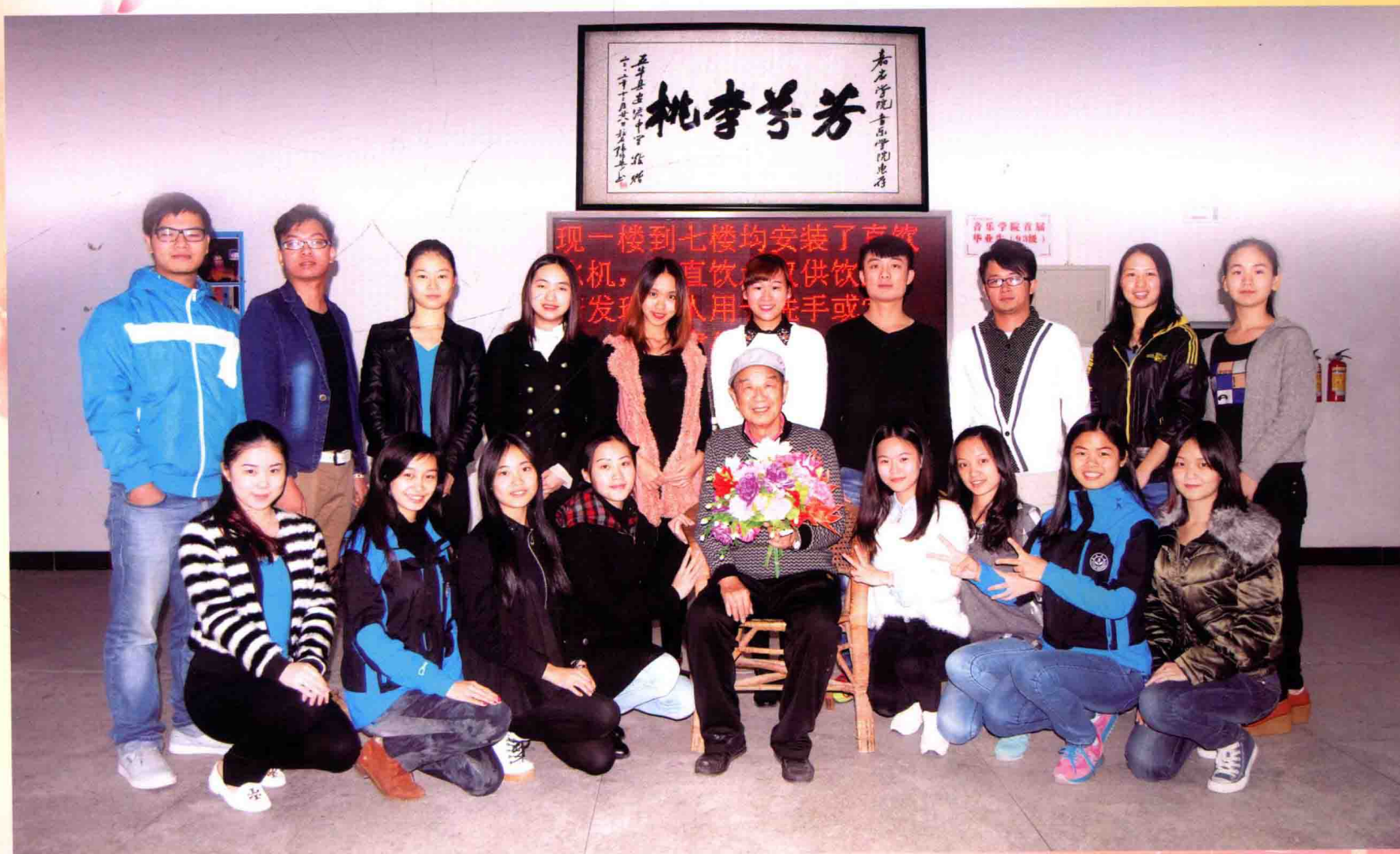
山歌班部分学生献花