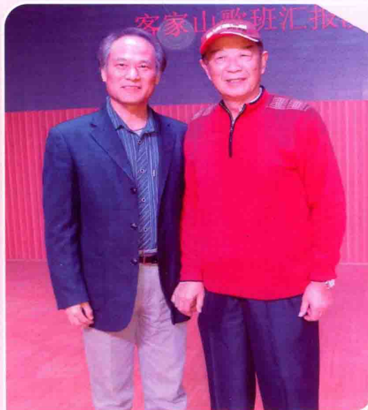
星海音乐学院温带宝馆长