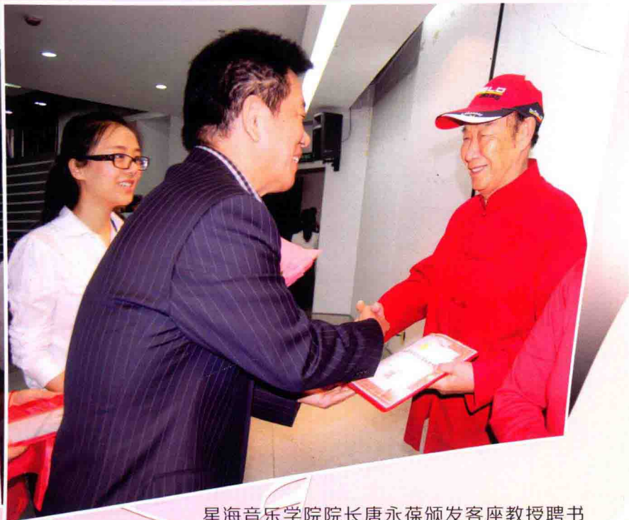
星海音乐学院院长唐永葆颁发客座教授聘书