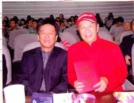
星海音乐学院院长唐永葆