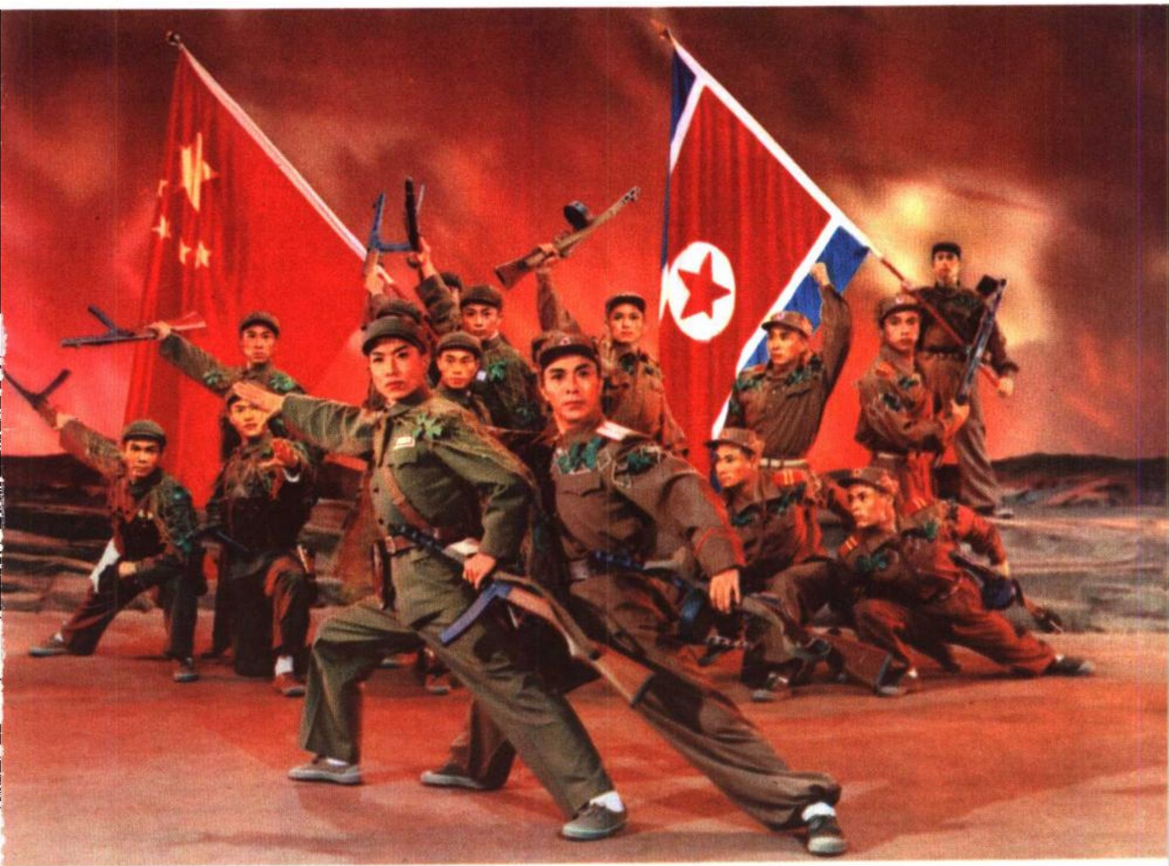
在战火纷飞的朝鲜战场上，中朝两国军队，团结战斗，并肩前进。