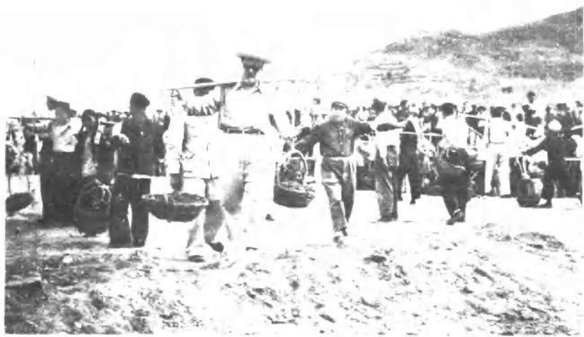
贺龙同志在十三陵水库工地参加义务劳动。 (一九五八年六月)