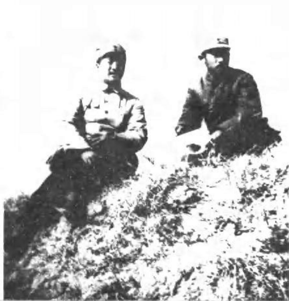
在冀中陈庄战斗中视察地形。 一九三九年，贺龙同志和关向应同志。