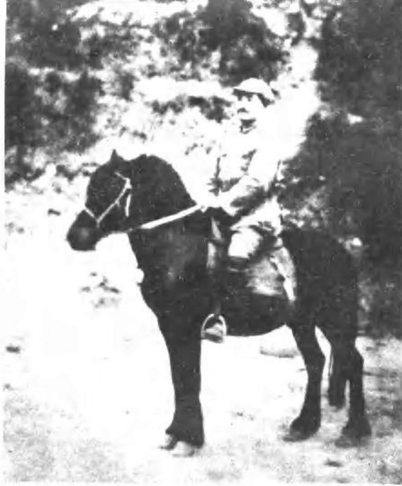
贺龙同志长征后在陕北。