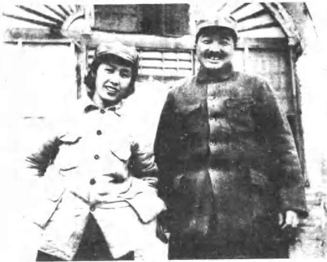
一九四七年，贺龙同志和薛明同志在山西兴县蔡家崖晋绥军区司令部。