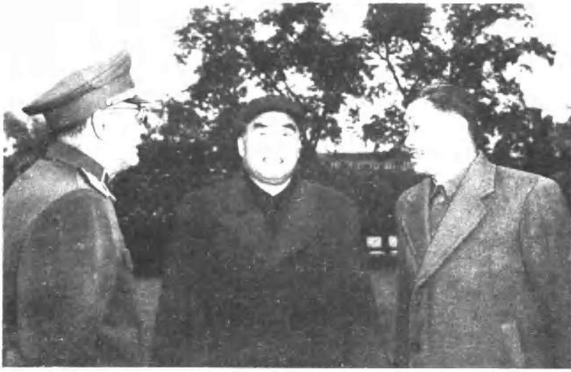
朱德同志和叶剑英、贺龙同志在北京 (一九五六年)