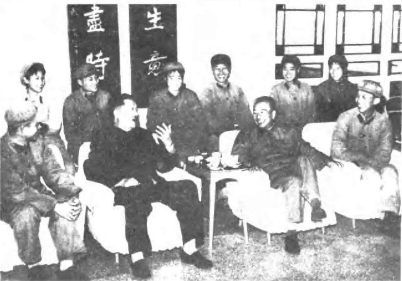
一九六六年九月十五日，贺龙同志与陶铸同志一起接见部队文艺工作者。