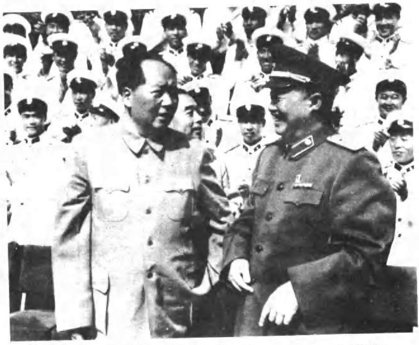
毛主席和贺龙同志在一起。 (一九五九年)