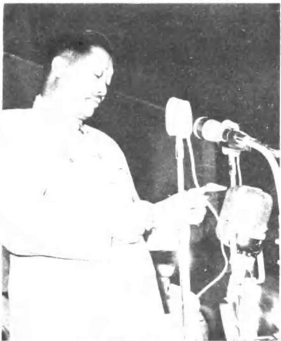
一九五九年九月十三日，贺龙同志在第一届全国运动会开幕式上致开幕词。