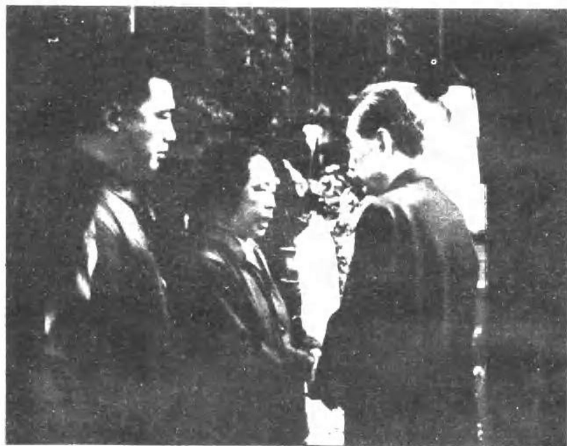
一九七五年六月九日，在贺龙同志骨灰安放仪式上，周恩来同志代表党中央和毛主席向贺龙同志家属薛明同志及其子女致亲切慰问