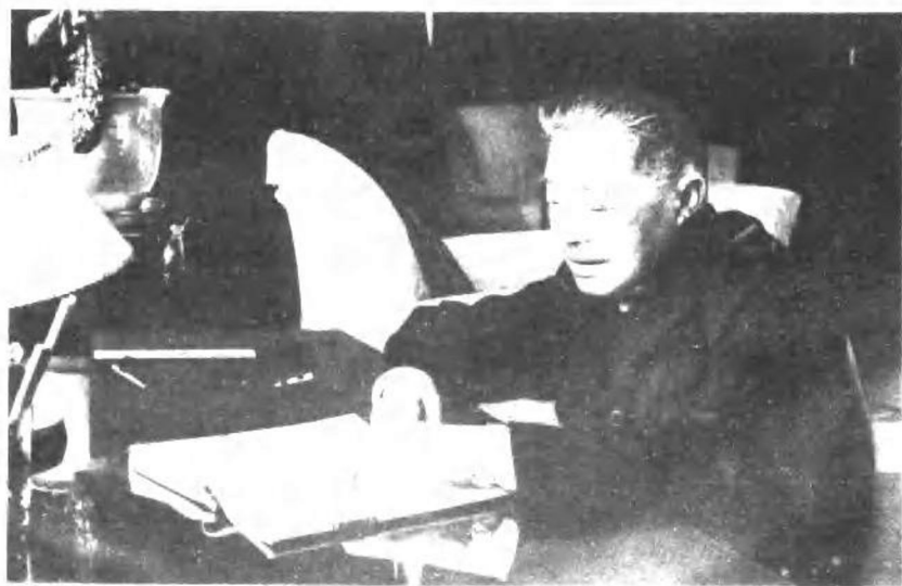
一九六六年二月，贺龙同志 在广州阅读《毛泽东军事文选》。