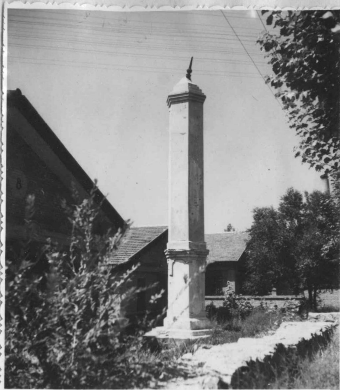
臨沂抗日同盟軍收復沂東失地陣亡將 士紀念塔——近照。