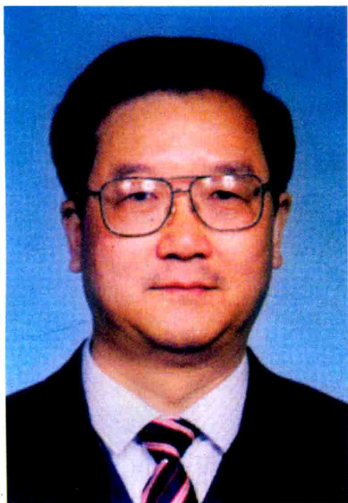
张文康 教授 中华人民共和国 卫生部副部长 国际传统医药大 会(北京2000)主席

传统医药学是人类文明的重要组成部分,在人类社会发展的历史长河中,它曾为世界各民族的繁衍和昌盛做出过重要贡献;由中华人民共和国国家中医药管理局与世界卫生组织共同发起的国际传统医药大会(北京2000),将是世纪之交国际传统医药界一次继往开来的学术盛会,随着传统医药学的应用和发展,21世纪的人类卫生保健事业必将展现新的面貌。