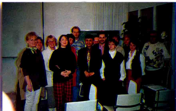
哈木拉提·吾甫尔教 授在实验室指导中外留 学生如何解决口服液制 剂抗氧化性、药效稳定 性、离子化处理工艺等 世界性难题。