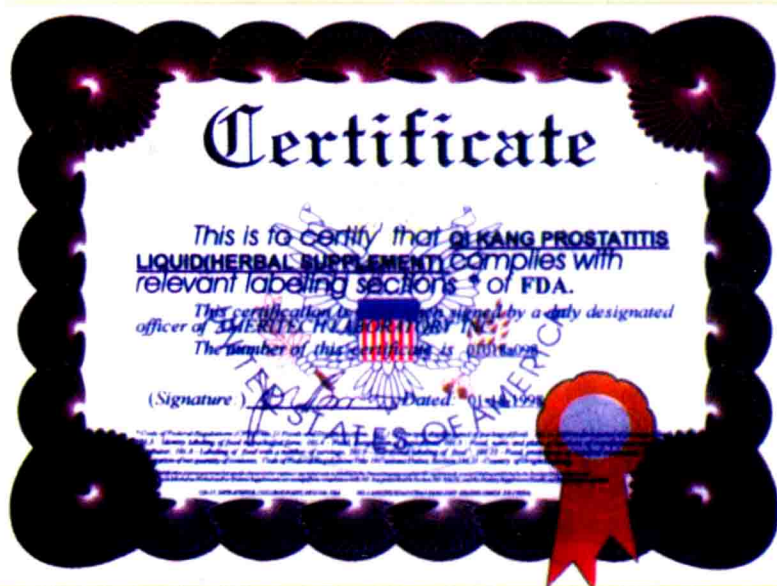
通过美国 FDA 认证