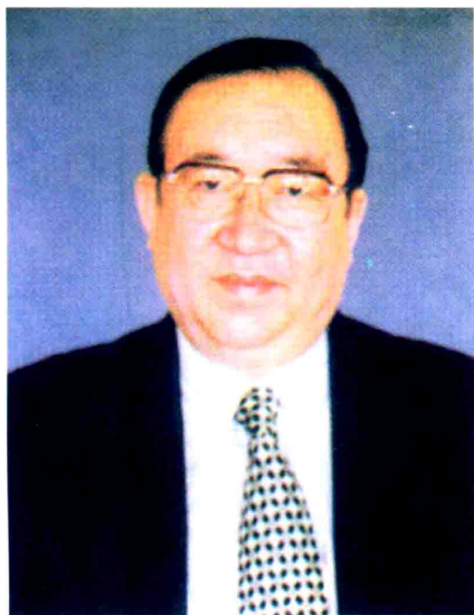
朱彦生 教授 中华人民共和国卫生 部副部长兼国家中医药管理局局长 国际传统医药大会(北京2000)组织委 员会主席

人类即将迈入21世纪。“人人享有卫生保健”仍然是新世纪世界卫生工作面临的重要任务。传统医药学中所包含的天然药物疗法、非药物疗法及心理疗法等等，具有避免或减少毒副作用、降低医疗成本、扩大基本卫生保健服务覆盖范围的突出优势。因此，科学而有效地发挥传统医药学的医疗保健作用，将成为21世纪世界卫生工作的热点之一。