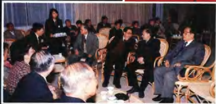
◀ 省、市領導、著名學者和香港文物鑒藏家等人參觀之後在休息室交談。