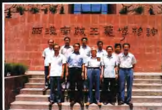
▲我國著名學者費蘭波(前排右三)到館參觀，這是參觀後在博物館門前合影留念。