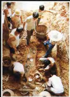
▲考古隊員在清理墓道。