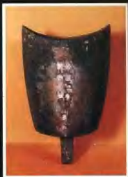
▶南銅勾鐘，八件一套，上有南越“文帝九年樂府工造”銘文，是唯一有絕對紀年的越式青銅樂器。