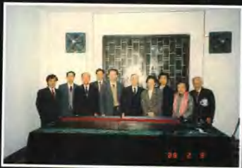
▲香港文物鑒藏家組織“版求精舍”的部分會員專程來館參觀。