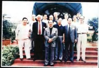
▲香港文物鑒藏家組織“求知雅集”部分成員來我館參觀後與我館工作人員合影留念。