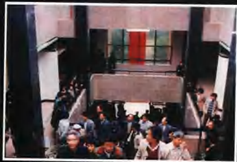
▲開館以來，觀眾絡繹不絕，這是觀眾來館參觀的盛況。