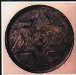
▲這是迄今考古發掘出土的唯一的一件六山紋鏡。