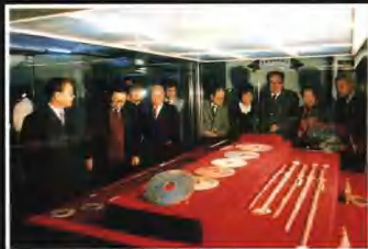
▲廣東省副省長楊立(前排左二)、著名畫家黎雄才(前排左三)、關山月(前排左四)等與致勒勒地在鑿書出自釋主人身上的瘡疤物。