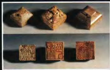
▲“泰子”、“帝印”、“避諱”三枚玉印。