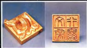
▲出自墓主身上的“文帝行璽”龍紐金印，證實了墓主人就是傳稱“文帝”的西漢南越國第二代王。