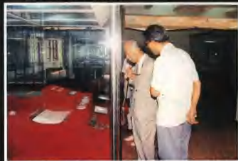
▲香港中文大學宗師館教授(右二)在仔細觀看出於龔主頭部的叉物。