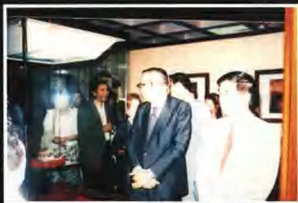
▲1991年9月意大利總理安德烈奧蒂在盧鍾鶴副省長陪同下到我館參觀，對陳列的出土文物深感興趣。