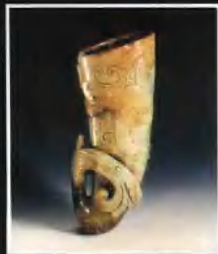
▶玉月杯，整玉琢成，外壁用圓雕、高浮雕、淺浮雕和陰刻技法雕出一條迴龍纏繞全身，布局巧妙，是漢玉中的一件稀世珍寶。