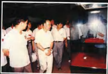
▲黎子流市長到我館參觀指導工作。