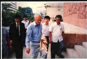
▲1988年9月新加坡總理李光耀來館參觀，司徒裕館長在大門外迎接。