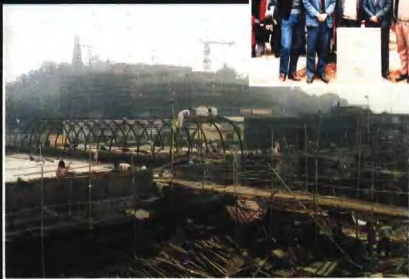
◀ 西漢南越王墓博物館第一期工程興建的綜合陳列樓，僅用十個月竣工，這是施工場景。