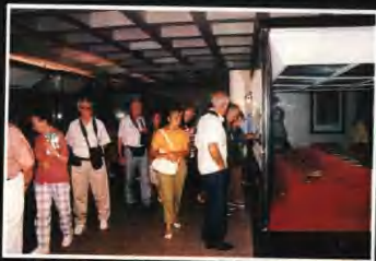
▲精美的出土文物也吸引了許多外國遊客。