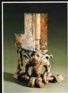
◀越人操蛇足坐屏風青銅托座，是越式銅器中的珍品。