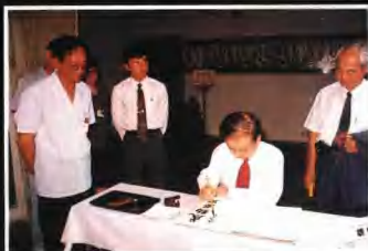
▲1992年9月，日本前首相海部俊樹在滬九達館長陪同參觀後，為我館寫下“感動歷史”的願詞。