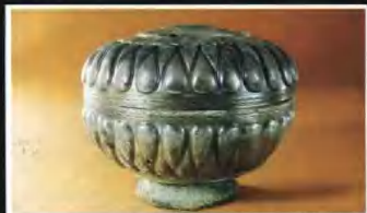
▲西亞出處的銅當在墓中出土，表明廣州這個口岸與西亞的海上交通，早在二千一百年前就已經開始。