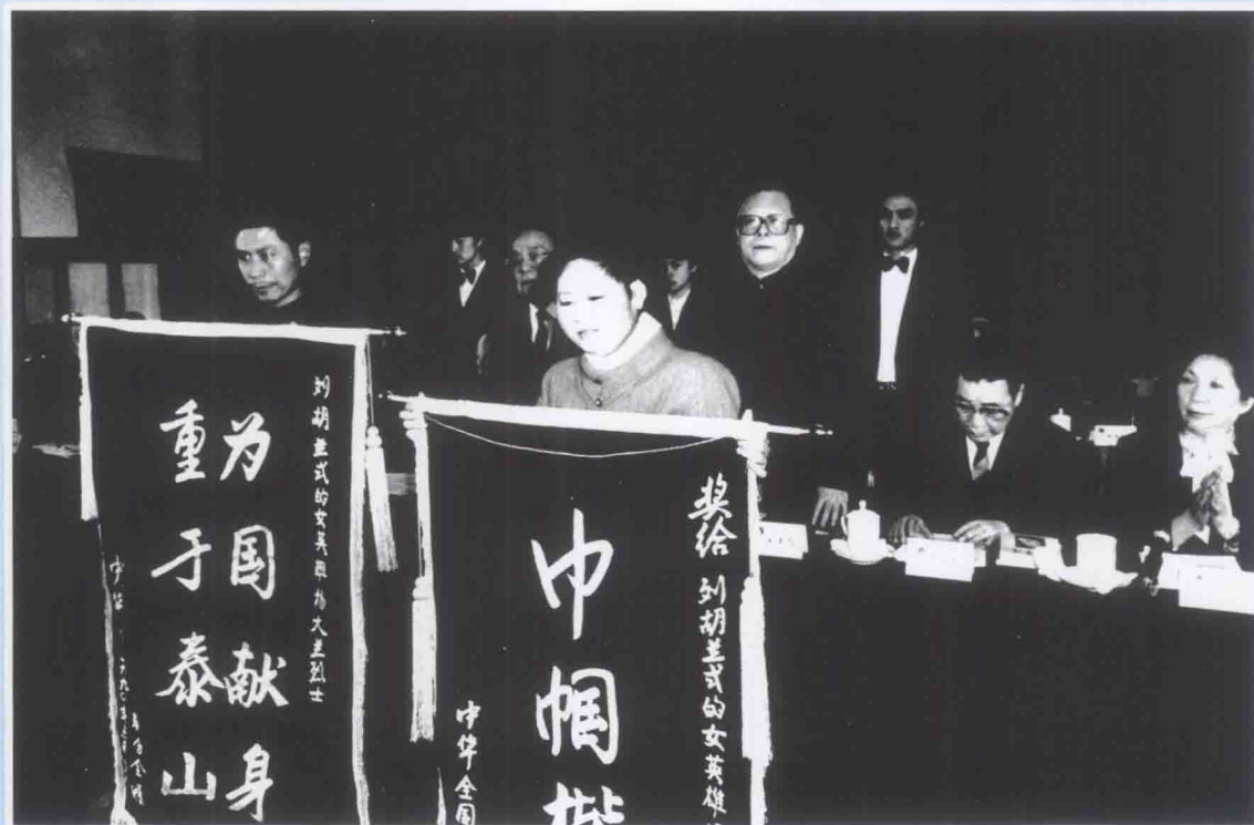
1990年3月7日，在人民大会堂、江泽民总书记、杨尚昆主席亲手为“两兰”颁发锦旗、奖章和证书。