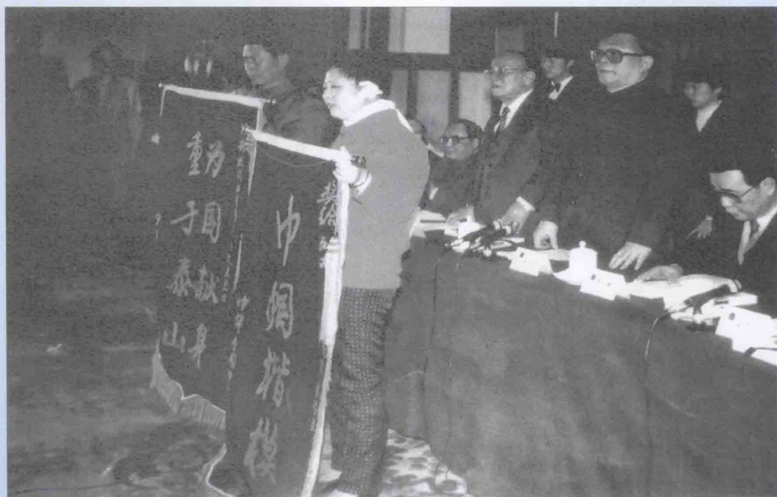
全国妇联在人民大会堂召开“三八”国际劳动妇女节80周年纪念大会，中共中央总书记江泽民、国家主席杨尚昆分别将绣有“巾帼楷模”和“为国献身”重于泰山的锦旗授予潘星兰和杨大兰烈士的父亲杨尚洪。