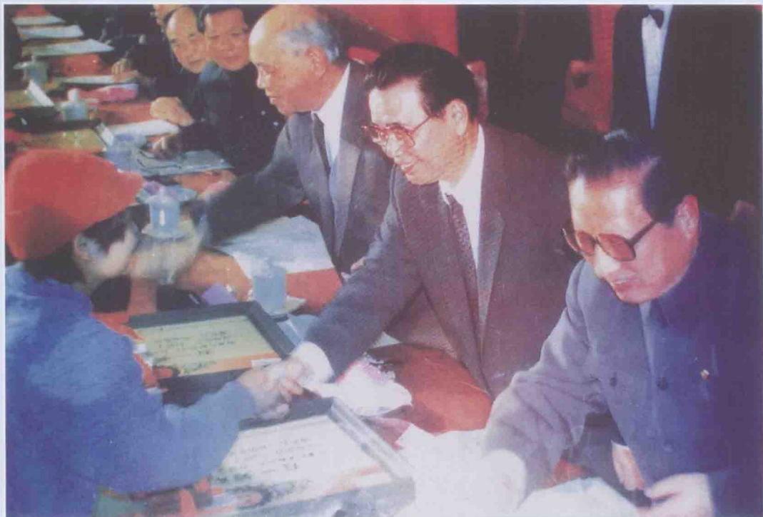
在中华全国总工会召开的纪念“五一”国际劳动节大会上，国务院授予潘星兰“劳动模范”，追授杨大兰“全国先进工作者”的光荣称号。图为李鹏、乔石、姚依林等中央领导同志向潘星兰颁奖。