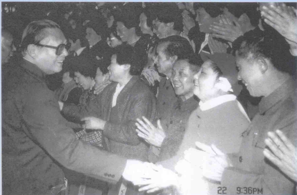
中共中央总书记江泽民在接见会议代表与潘星兰亲切握手