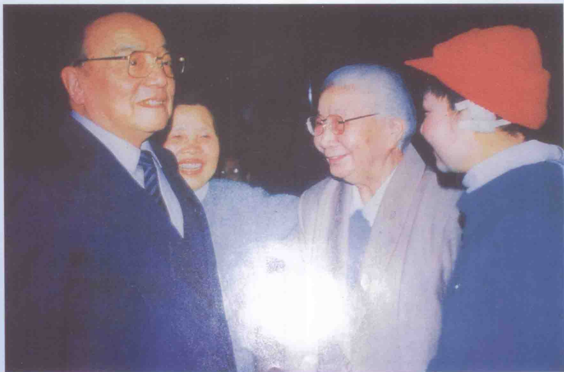
国家主席杨尚昆同志接见潘星兰同志