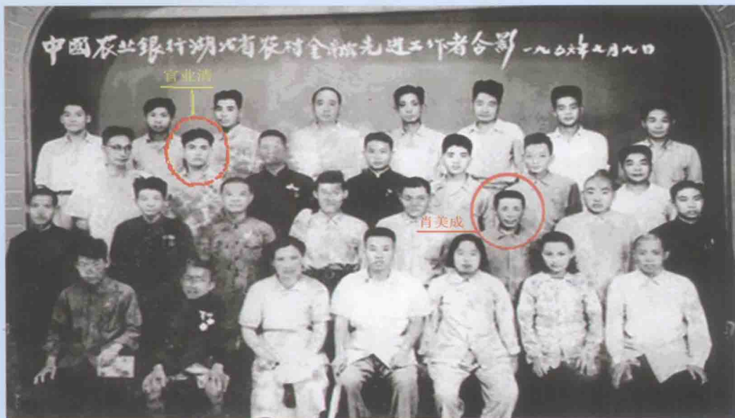
参加全国农金工作会议的湖北省代表团（1956.7）