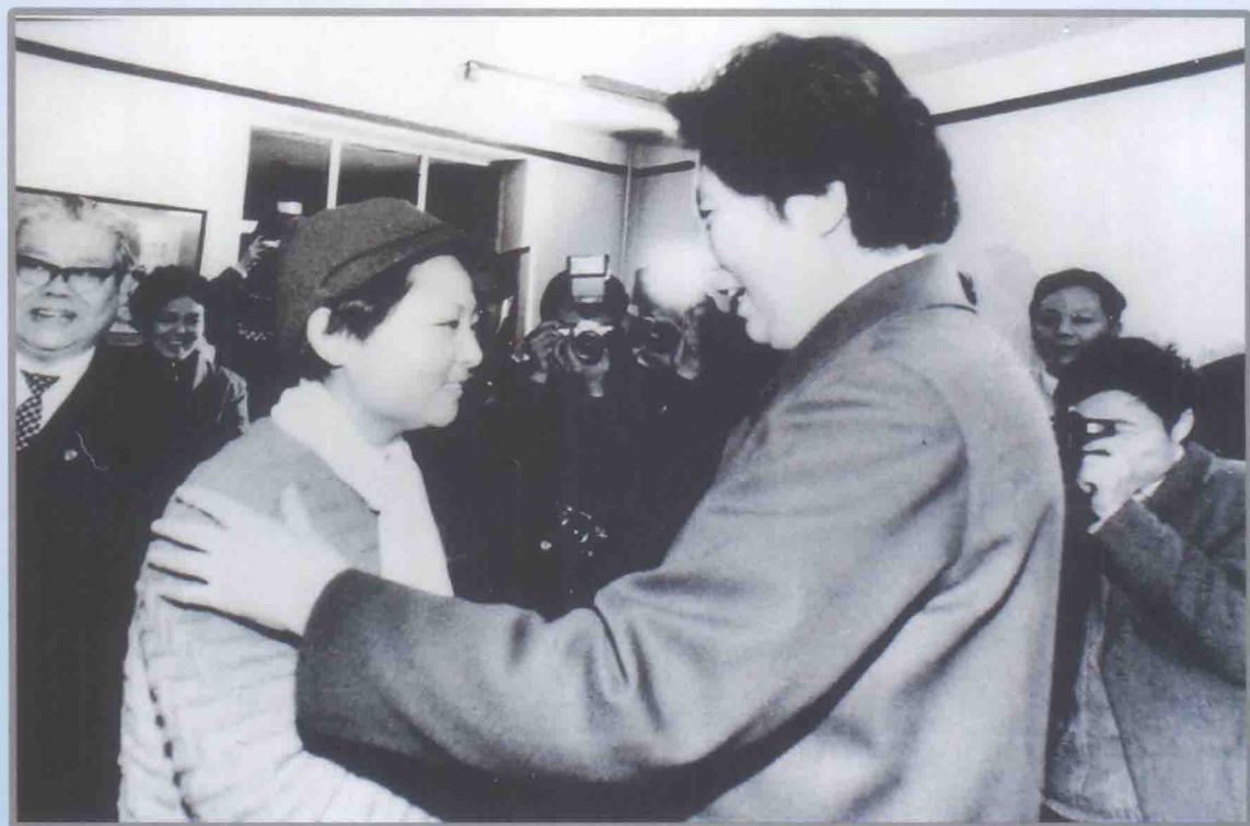
陈慕华亲切接见潘星兰同志