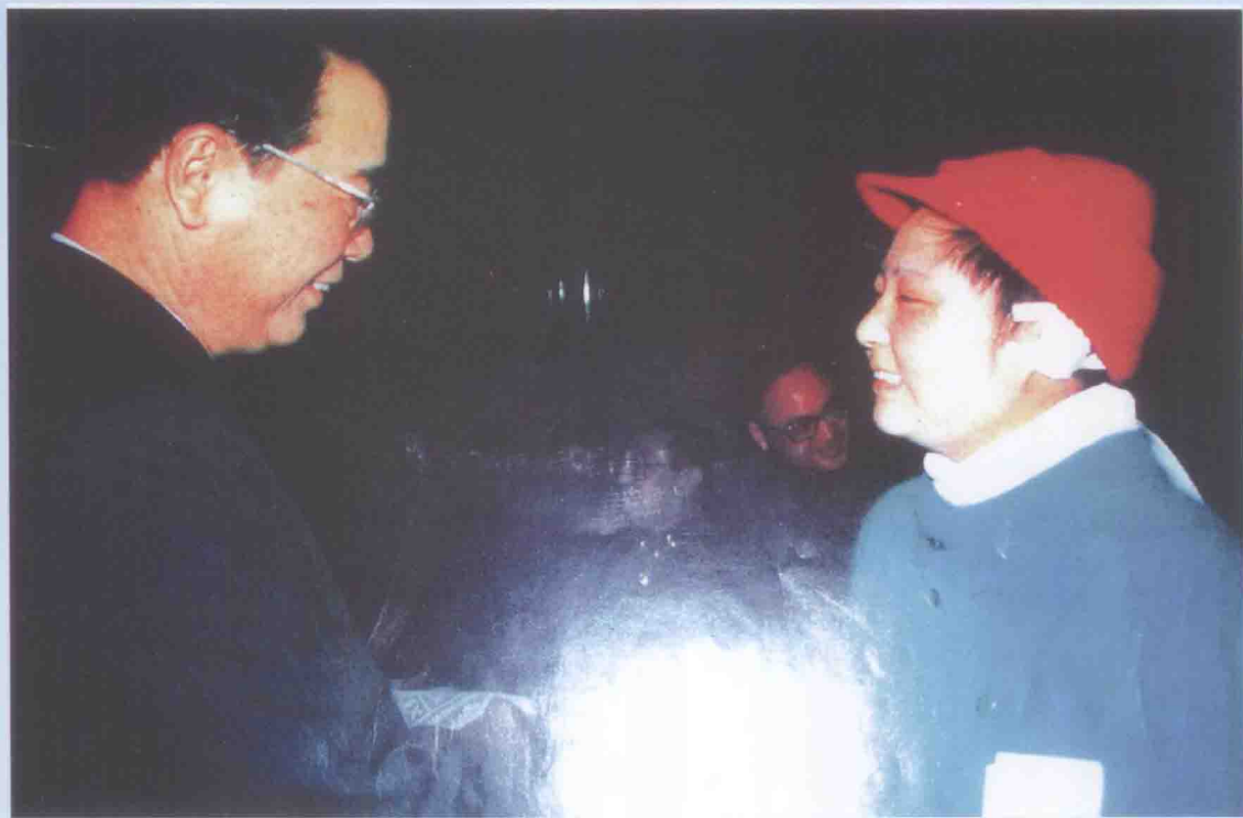
国务院总理李鹏接见潘星兰同志