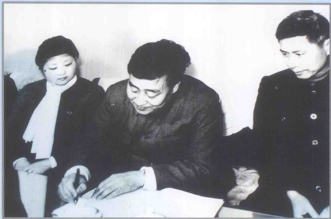
国务委员兼中国人民银行行长李贵鲜为“两兰”题词