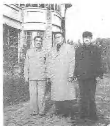
与刘伯承同志(中)合影