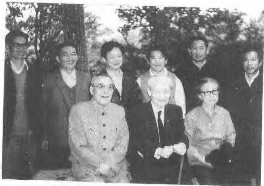
陪同赵朴初夫妇(前右一、二)在潜山合影