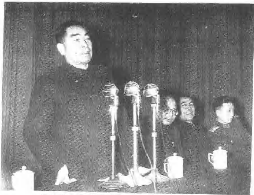
1958年1月，周恩来同志在合肥江淮大戏院作报告，右二为张恺帆。