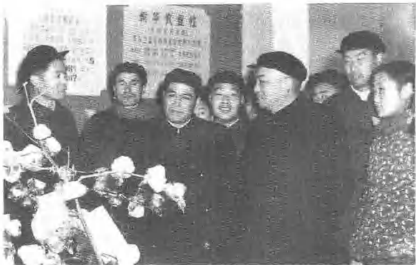
1958年12月陪同彭德怀同志参观省博物馆。