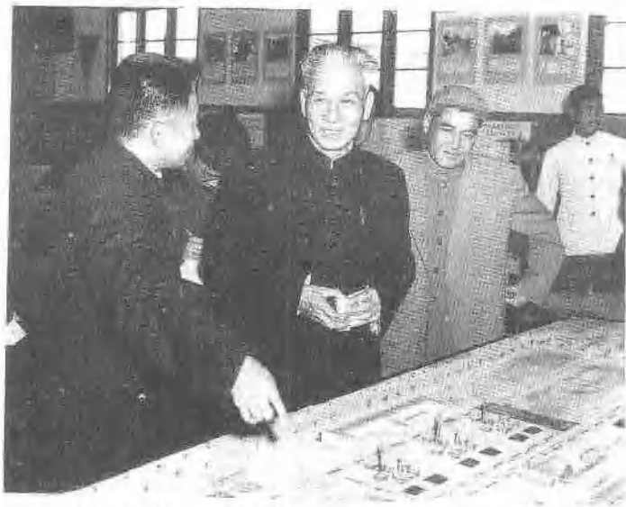
1958年10月，陪同刘少奇同志参观合肥工业大学科研成果展览。