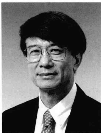
朱经武 香港科技大学校长