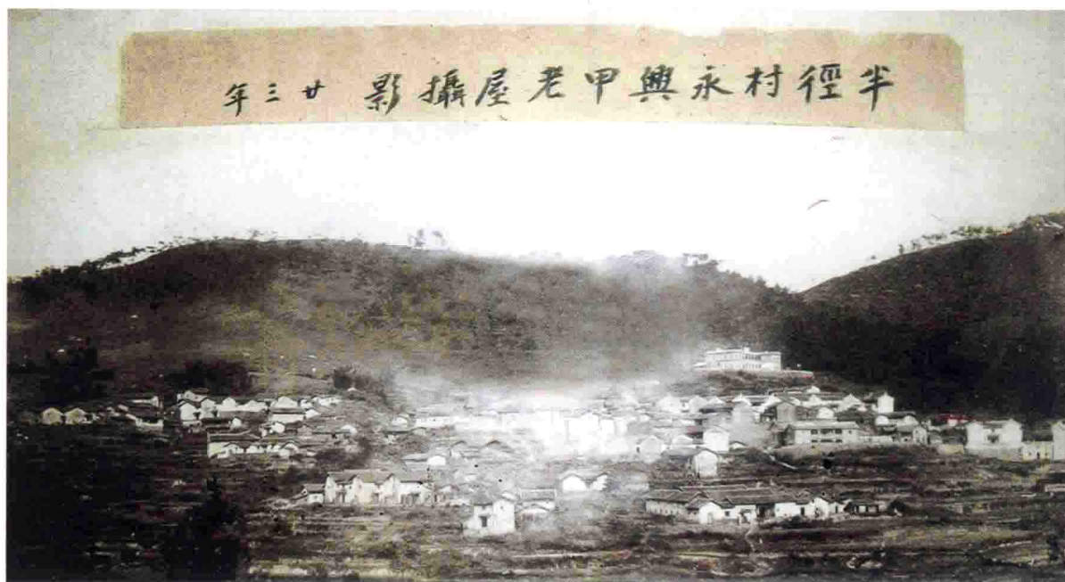
半径村旧貌（摄于公元一九三四年）