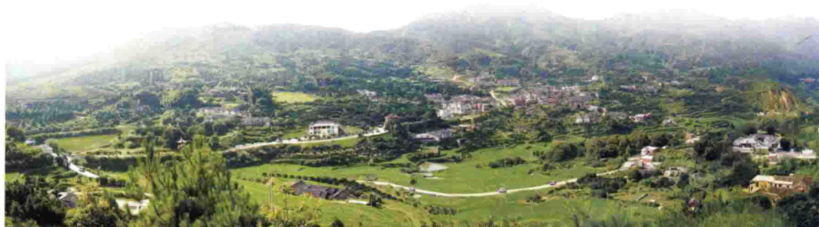
半 徑 新 貌