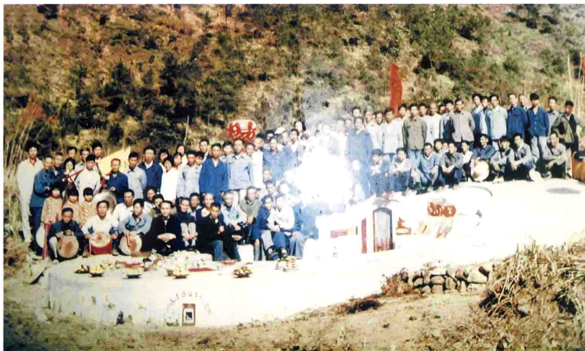
远绍公地坟重修园坟祭祀留影（公元一九八四年）