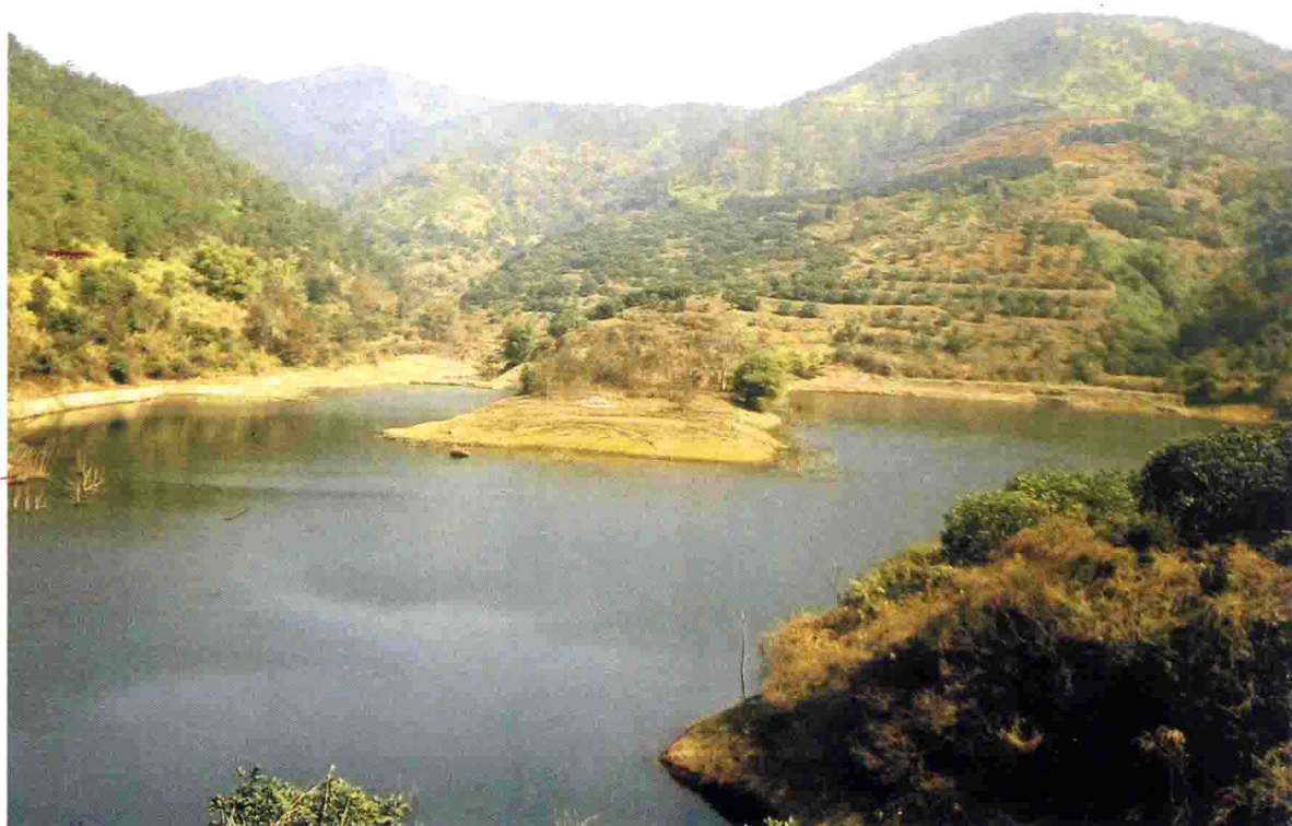
远绍公地坟远眺（大坪蕉龙潭）