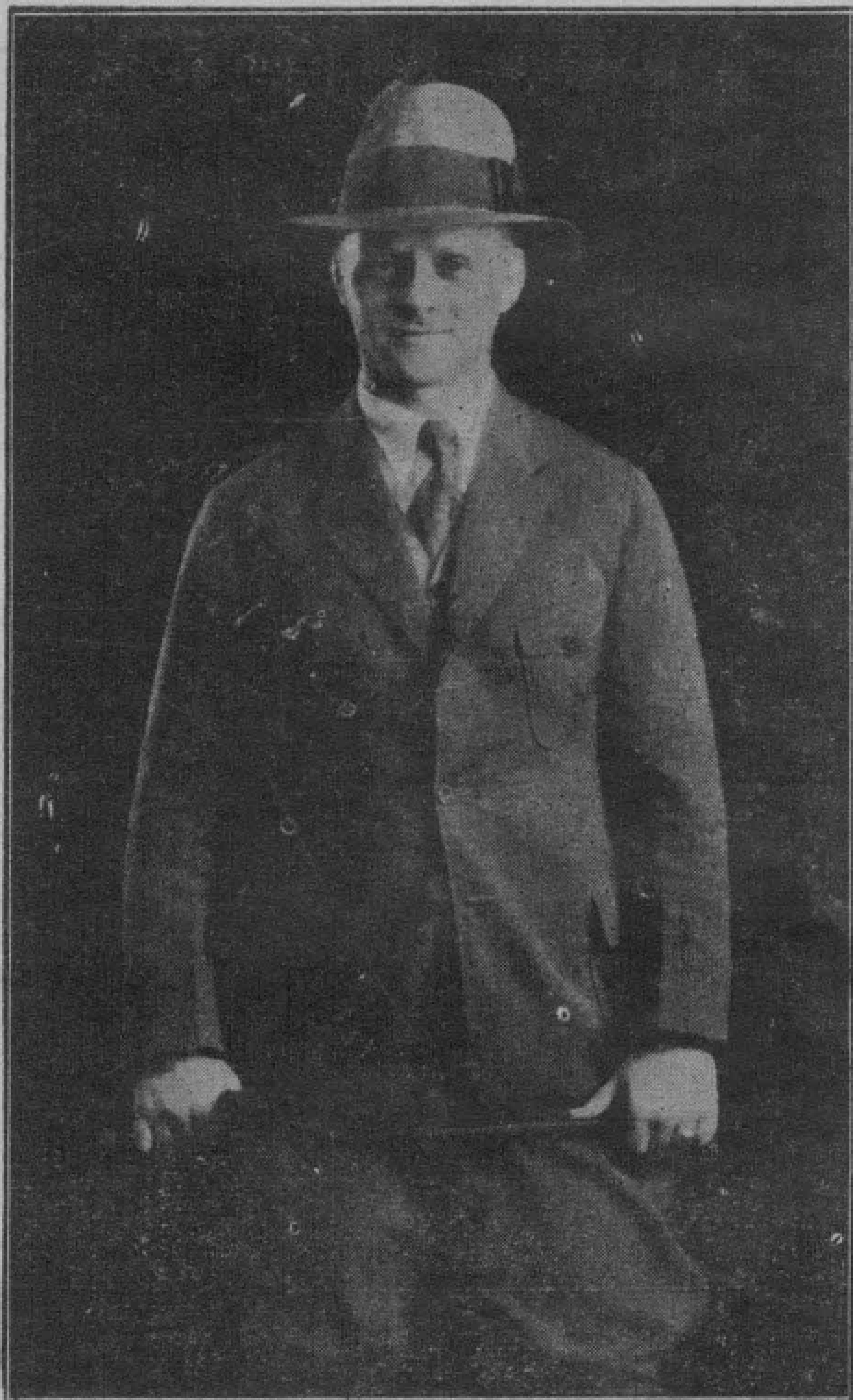
德 顧 問 胡 諾 斯 坦 肖 像