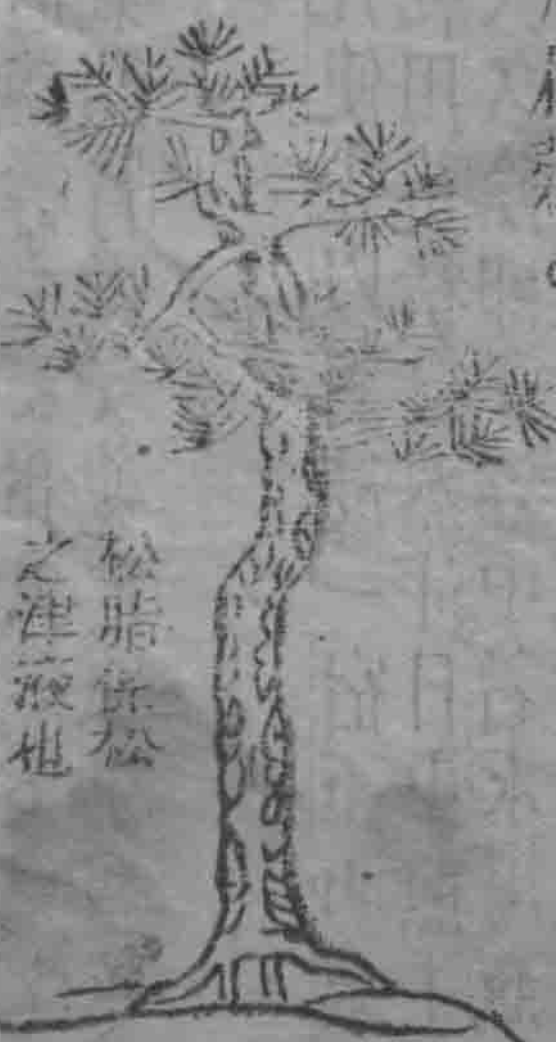
松脂食松之津液也