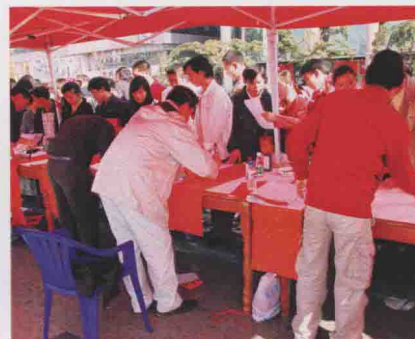
免费为市民写春联活动