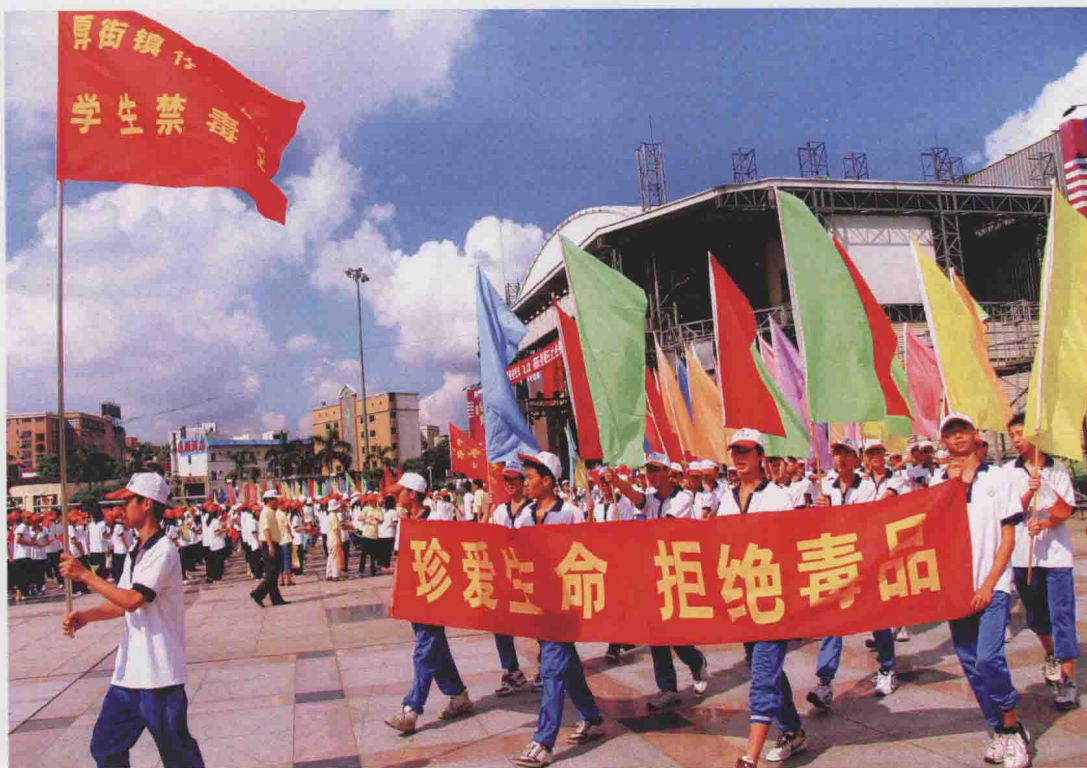
每年一度的禁毒大游行