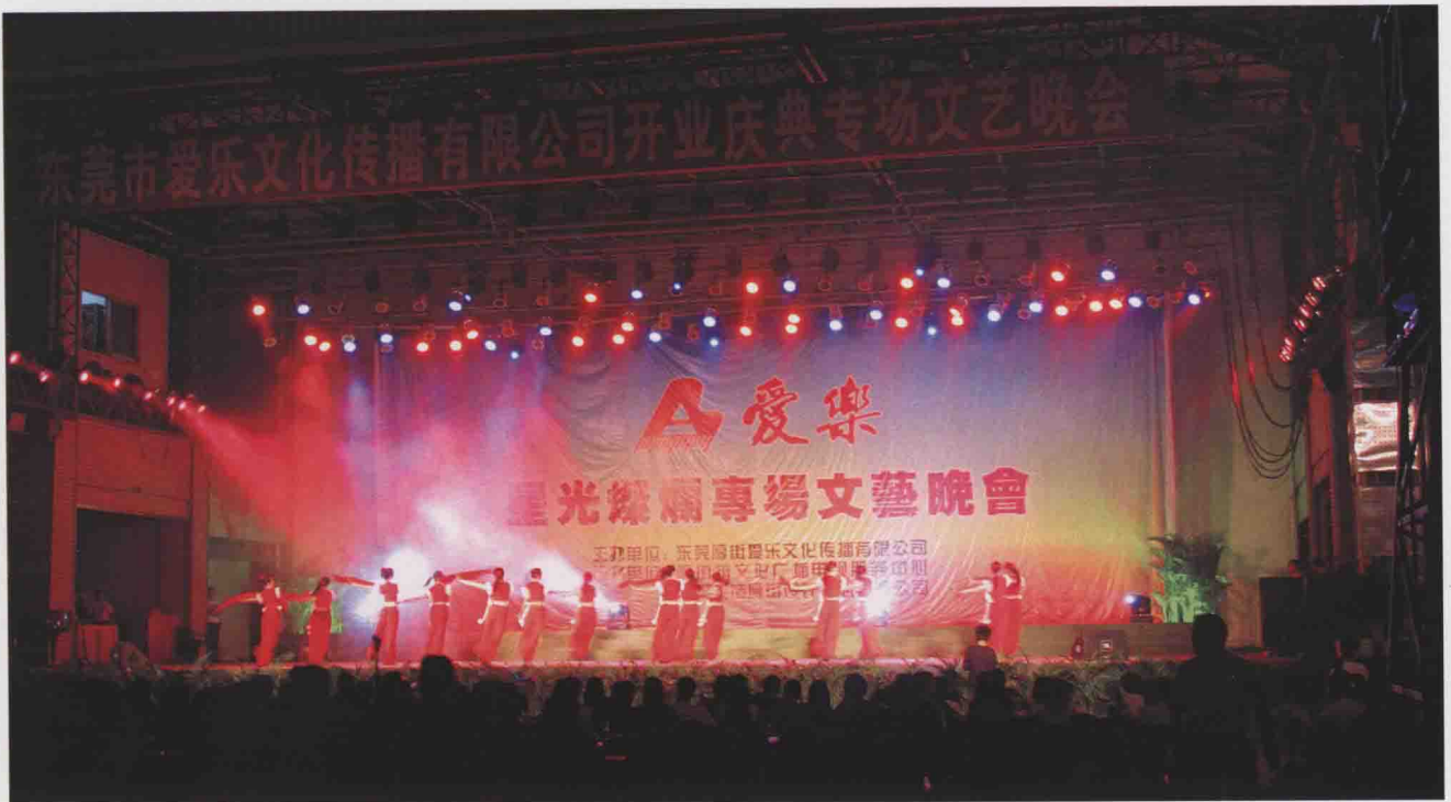
企业文化专场晚会