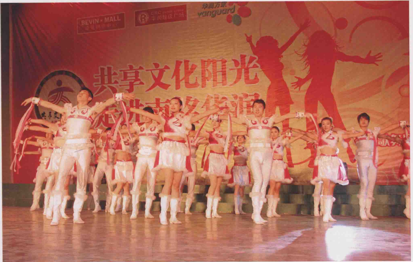
企业文化专场晚会