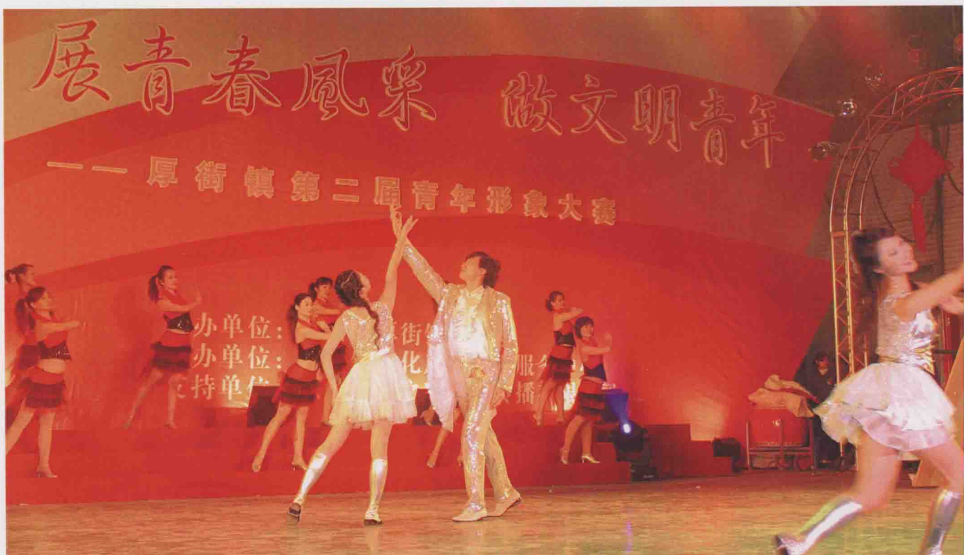
青少年文化专场晚会

(2) 我镇积极以厚街广场为文化建设的主阵地，不断创新广场文化建设的内容和形式，年均开展社区文化、家庭文化、企业文化、校园文化等群众文艺展演活动40多场，使广场文化逐步由单纯跳舞向文艺展演转变，由一般娱乐向传播知识转变，由单一文化活动向文化、经济活动并举转变。