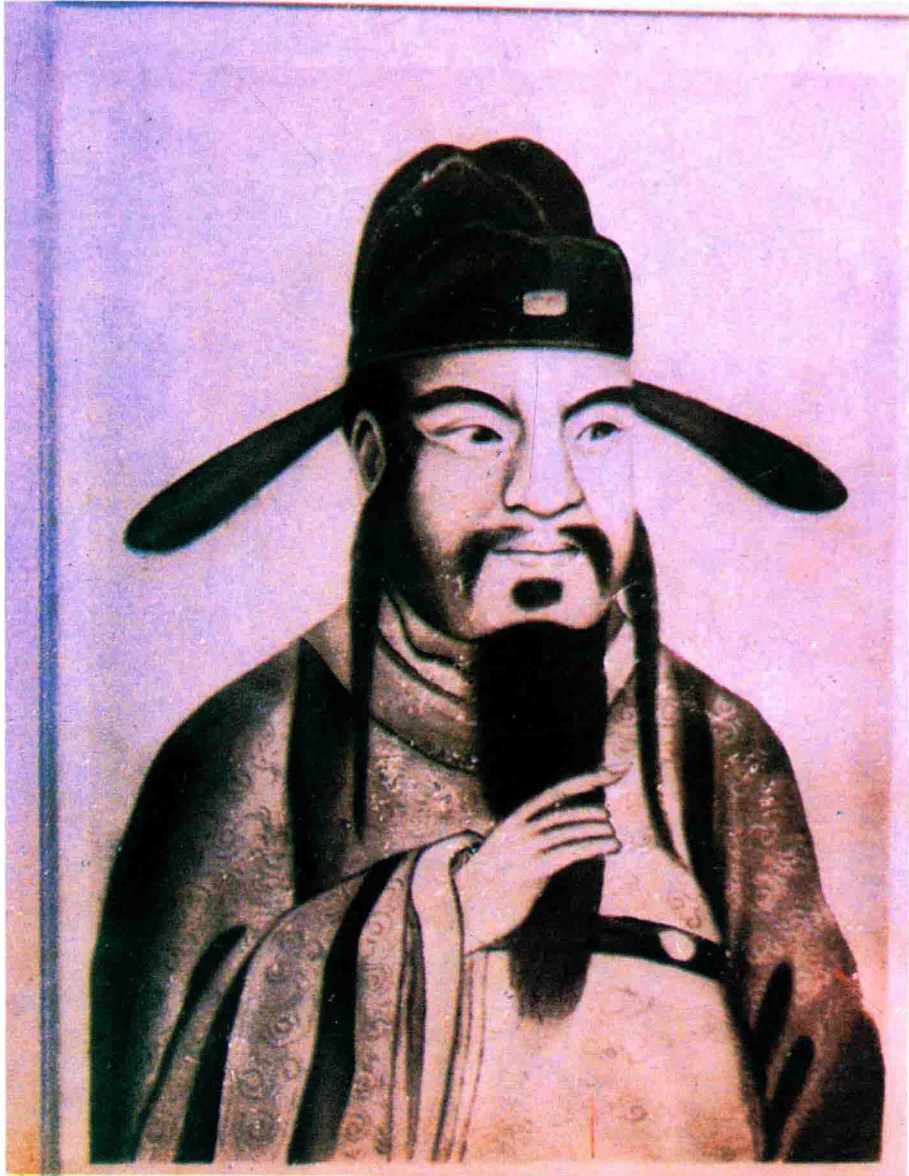
入閩始祖李火德公像