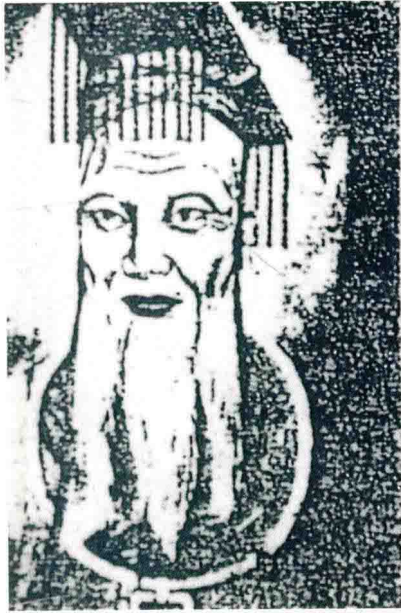
中華民族始祖軒轅黃帝