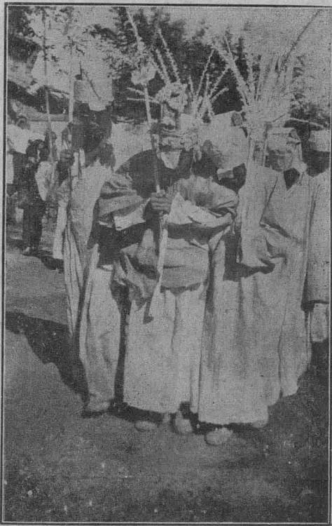
出殯時靈柩前的孝子