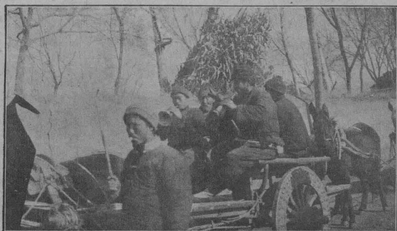
迎 娶 時 喜 轎 前 的 吹 鼓 手