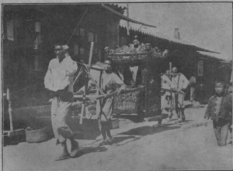
迎 娶 時 的 喜 轎