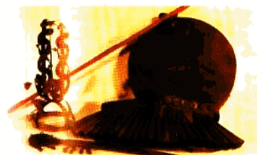
祭祀神具(神帽、神铃、手鼓、腰铃、神刀)