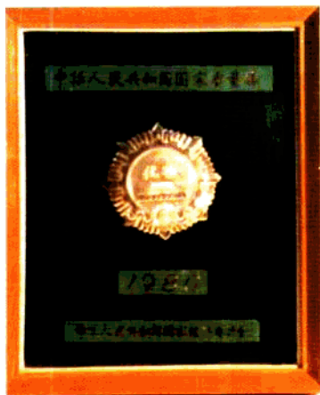
1980年,该厂高纯度绝缘木浆获国家质量银质奖。