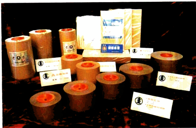
该厂绝缘木浆、电缆纸、电容器纸的部分纸样。