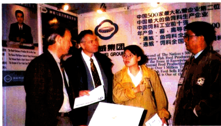
该公司应邀组团参加 '96 青岛中国国际渔业博览会，美国与会者正在询问该公司情况。