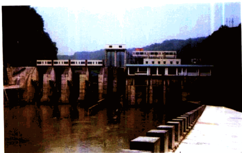
该公司装机 4.5 万千瓦的黄丹水电站