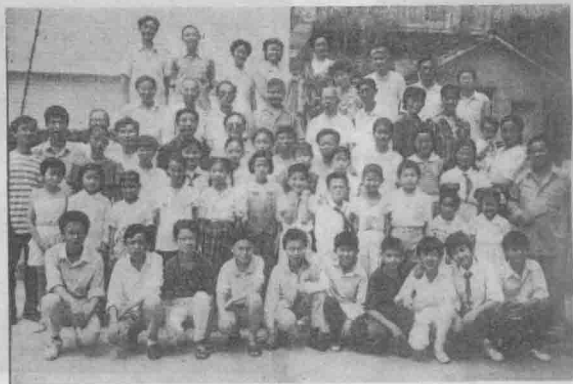
'92 遵义市少儿曲艺培训班师生合影