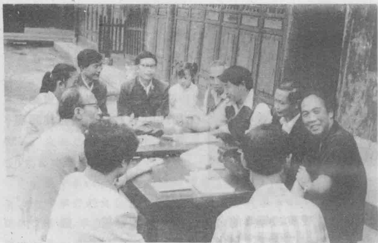
遵义市曲艺家协会召开改稿座谈会。