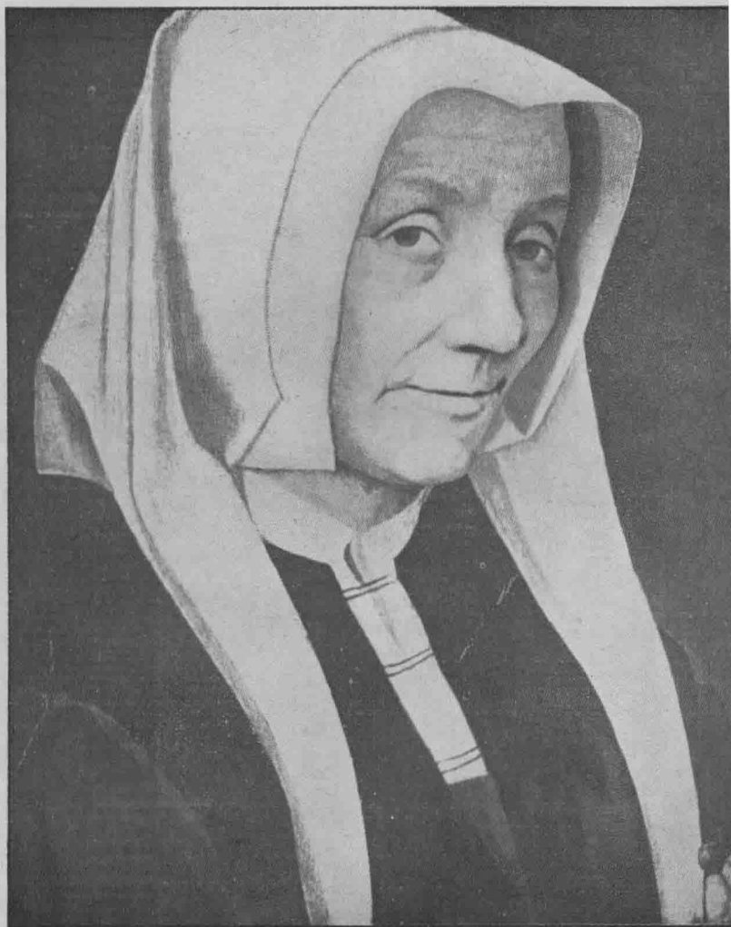
The Perry Pictures Boston Mass.