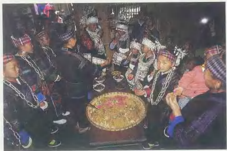
苗族人民多以村寨为单位聚族而居。民居建筑多为土木结构,形式各地不同。黔东南、桂北等地的吊脚楼颇富特色(左上图)。苗族饮食以大米为主,辅以玉米杂粮,喜食糯米和酸辣(左下图)。