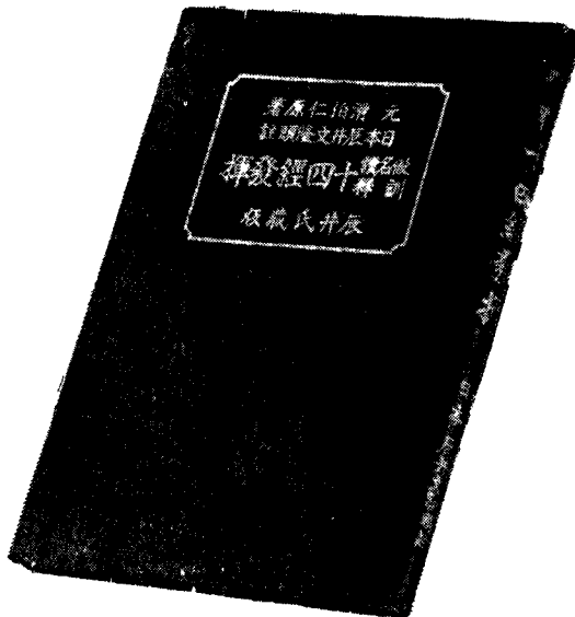
“十四經發揮”在日本之日文譯本縮影