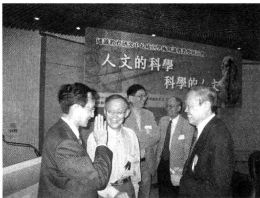
杨叔子（左二）与杨振宁等亲切交谈

“大学语文”是高等院校非中文专业的公共基础课，是大学生文化素质教育的一个极为重要的组成部分。这门课程自上世纪80年代在我国高校恢复开设以来，成绩巨大，经验很多。但在今天全球化进程不断加快、对高校人才规格需求不断提高的前提下，“大学语文”课程设置及教材编写就非常有必要进行新的改革，《大学语文新编》正是这一探索的成果。