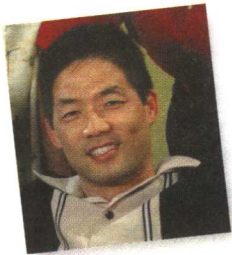
Name: Takeshi Mifune Age: 26 Hometown: Osaka, Japan Profession: film student

"City Living" is the story of the day-to-day lives of six friends living, studying, and working in New York City. Takeshi Mifune is a film student from Osaka, Japan. He lives with his best friend Mike Johnson, a struggling actor from Minneapolis, Minnesota. Tara Greene is a student and waitress from Nottingham, England. Her roommates are Sun-hee Park, a computer instructor from Seoul, Korea (R.O.), and Claudia Oliveira, a software sales manager from Rio de Janeiro, Brazil. Claudia's boyfriend, Roberto Chavez, is a financial analyst from Mexico City, Mexico. Interesting, exciting, and always fun—that's "City Living"!