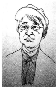
绫辻行人 Ayatsuji Yukito (1960 - )