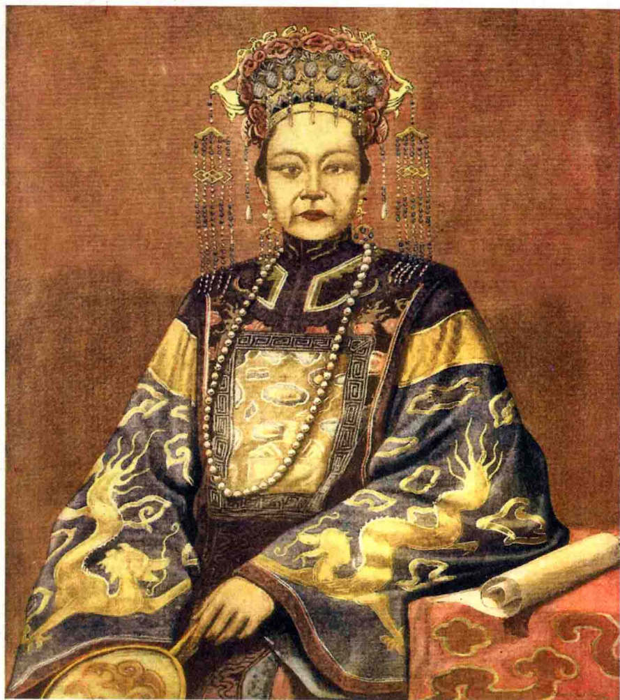
西方画家笔下的慈禧太后是一个统治中国近50年的令人生畏的女王形象。