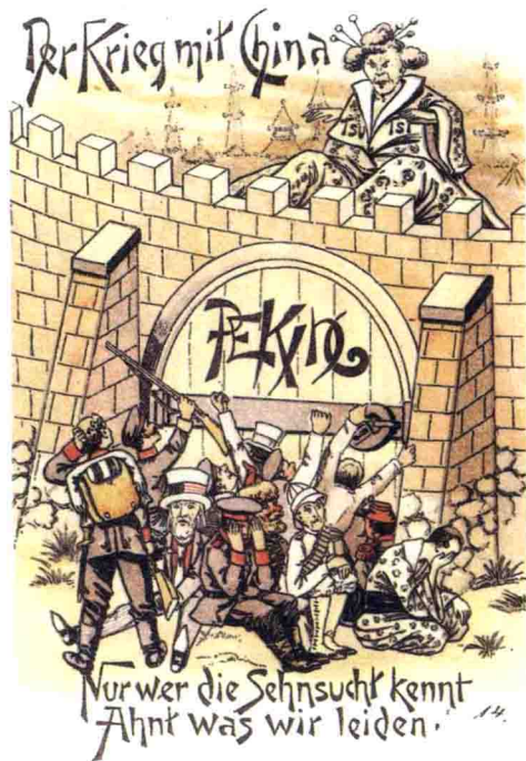
慈禧太后坐在北京 城墙头。(漫画明信 片)