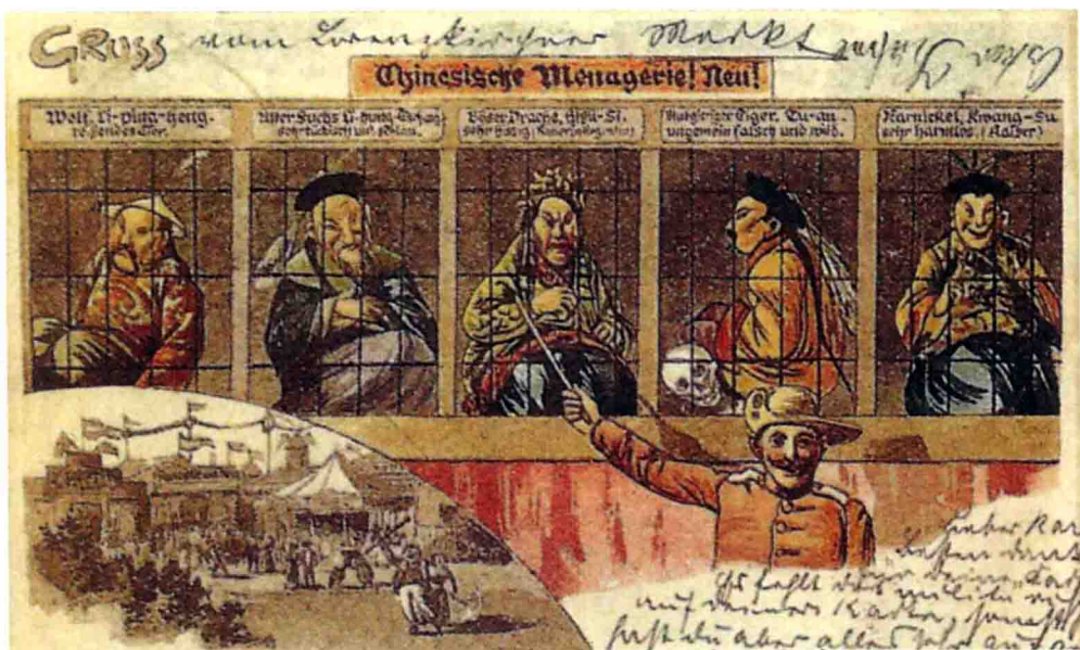
被关押在监狱中的慈禧太后和大臣。(漫画明信片)