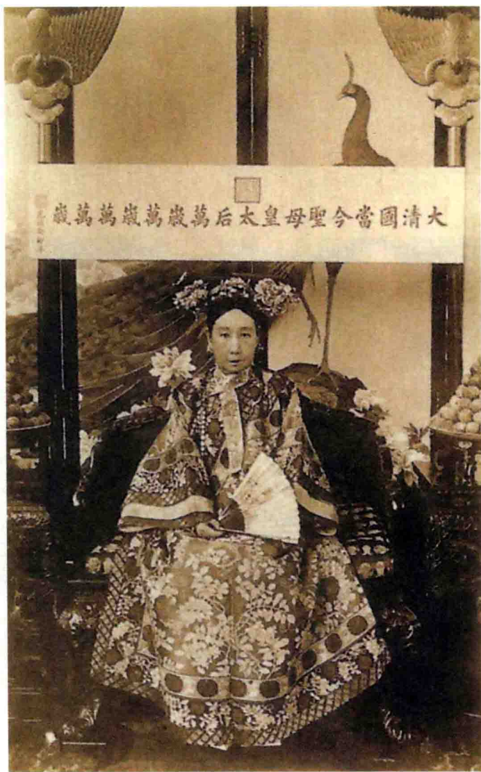
慈禧太后，滿族人，道光十五年十月十日（1835年11月29日）出生，光緒三十四年十月二十二日（1908年11月15日）病亡。又稱“西太后”“老佛爺”。她是晚清政府腐敗殘暴、軟弱無能的總代表。（明信片）