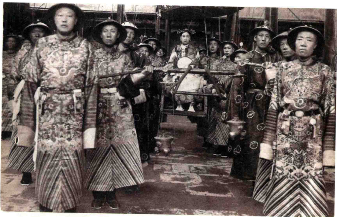
慈禧太后出行。右前方第一人为大太监李莲英。（明信片）