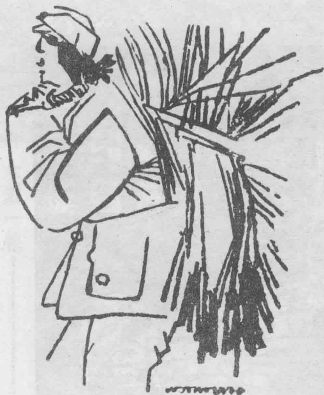
延安學生勞作之一——背柴