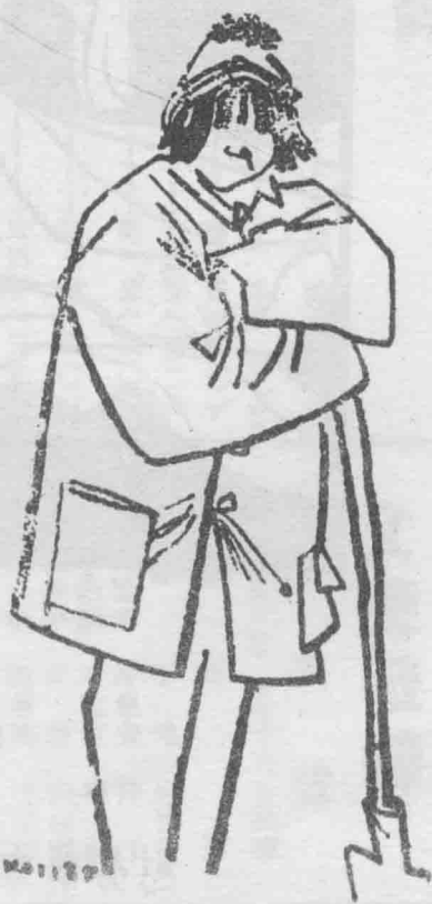
延安學生勞作之二——挖窯洞