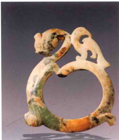
魏晋六朝 玉龙凤佩