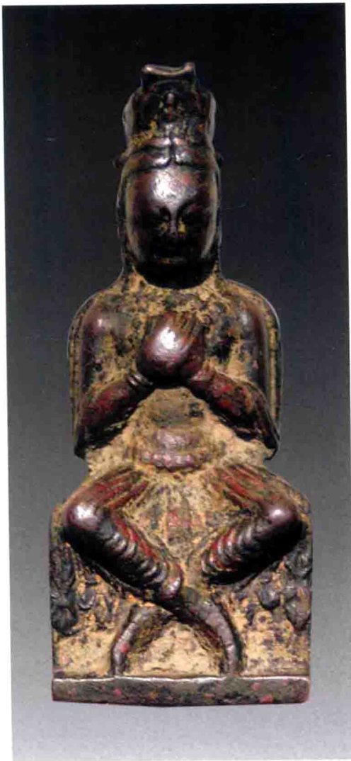
十六国时期 金铜交脚弥勒佛坐像

古玩是清乾隆年间出现的术语，泛指各种宝物，并非古物之专称。“玩”是收藏鉴赏的俗称。古玩有“杂、古、真、精、奇”五大特点。杂，指古玩的类别和品种繁多。古，指前朝遗物，泛指制作年代古老。真，指材料、作者都确凿无误，也指原创作品。精和奇，指古玩具有料优工精的艺术品质和艺术价