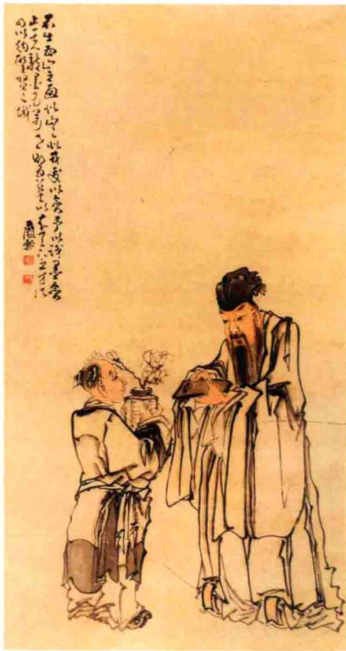
清代 黄慎画东坡玩砚图

历代都有“现玩”，今人认为是“古玩”传世品，大多是当年收藏者以“现玩”品买入收藏的，随着社会的变迁变成了古玩，价值也在增加。如现代紫砂艺术