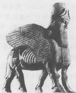
图 1-1 人首飞牛

当时，波塔的目标是发掘尼尼微古都，这也是当时众多考古学家梦寐以求的发掘目标。因为《圣经》中屡次提到尼尼微，尼尼微是亚述帝国的首都，是两河流域最有名的城市，而找到尼尼微遗址必将轰动世界。1842年12月，波塔在他认为是尼尼微遗址的库云吉克（Kouyunjik）土丘进行挖掘，但由于挖掘的深度不够，收获不大。波塔认为此地一定不是尼尼微遗址，就放弃了此地。后来证实，库云吉克土丘是亚述古都尼尼微的一个宫殿的遗址。虽然波塔错过了库云吉克土丘，但是仍有一个机会在等着他。1843年3月，他把挖掘地点转向了位于摩苏尔西北10英里 ① 处的赫尔萨巴德（Khorsabad）土丘。赫尔萨巴德是亚述王萨尔贡第二（Sargon II）统治时期建立的新都，古代名称为杜尔沙如金（Dur-sharukin）。据当地人讲，泥板、楔形文字砖和刻有浮雕的石板对他们来说早已司空见惯，他们甚至把这些东西作为建筑材料使用。波塔在赫尔萨巴德土丘进行简单的挖掘之后，便发