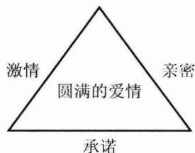
图 1-1 爱情三角形

值得庆幸的是，近几十年来关于爱情的研究越来越受到重视，许多社会科学家开始倾注精力研究婚恋问题，每年都有上百本关于爱情与婚姻的专业论文和书籍出版，很多成果都是来自科学的实证研究。对于爱情的探究已不再是诗人、哲学家和智者的“专利”。在众多关于爱情要素的研究中，最重要的理论成果出自于美国耶鲁大学的心理学家罗伯特·斯腾伯格（Robert Sternberg），他是这个新兴研究领域里的先锋人物。1986年，斯腾伯格教授提出了著名的“爱情三元论”。他认为，人类的爱情虽然复杂多变，但基本上包含三个主要成分，即激情、亲密和承诺。在构建该理论模型时，斯腾伯格对每一个成分给予了清楚的诠释，并且用三角形来表示爱情的结构。如图1-1所示，三角形的三条边代表爱情的三个成分，三者合为一体便组成了圆满的爱情。这一“三角形模式”是迄今为止最卓越的爱情理论之一，它可以很好地描述和解释人世间纷繁变化的爱情形态。