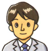
スタット スタット がいしゃいん 会社員 25さい 25歳・タイ