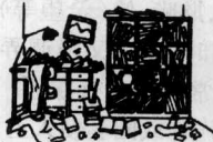
in a mess 一团糟

mess [mes] n. ①凌乱状态,脏乱状态②混乱的局面,困境 vt. 弄糟,弄脏,搞乱