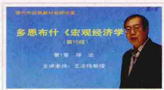
北京大学王志伟教授