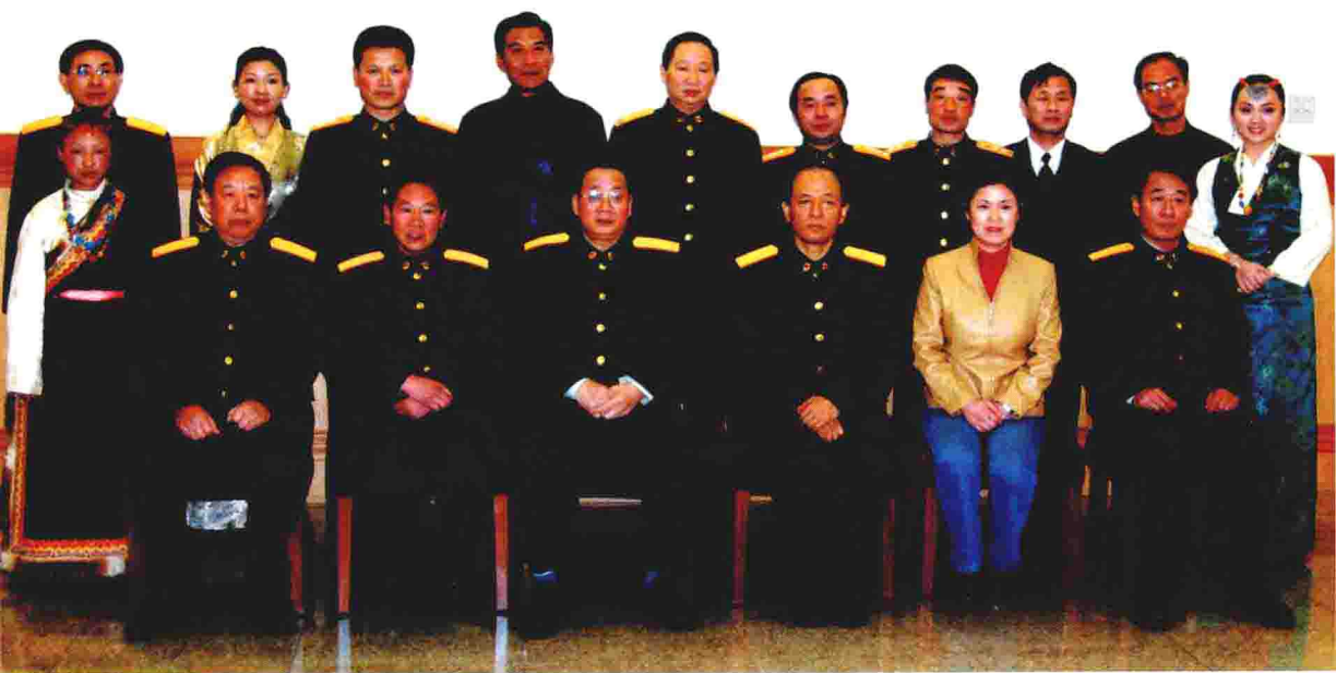
中央军委委员、总后勤部部长廖锡龙等领导与李素芝先进事迹报告团成员合影 ▲