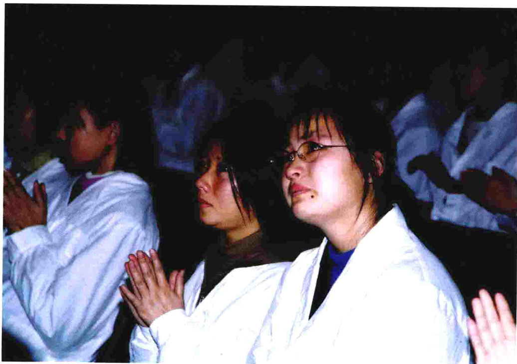
李素芝先进事迹感动医务工作者 ▲