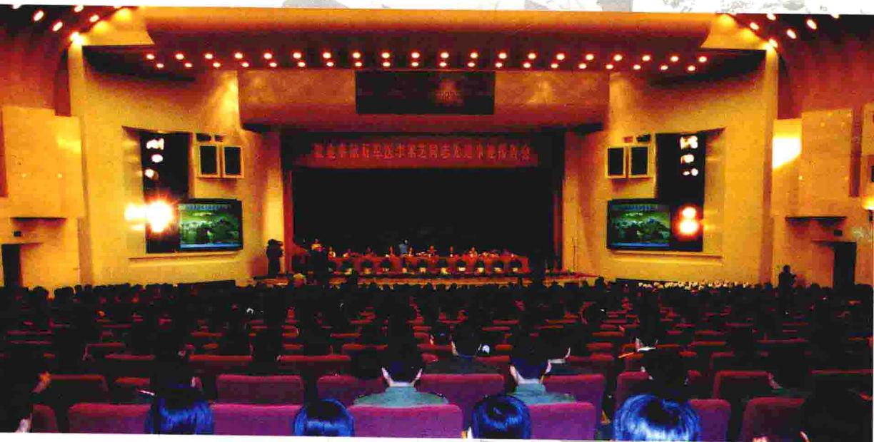
李素芝先进事迹报告团在北京人民大会堂作报告 ▲