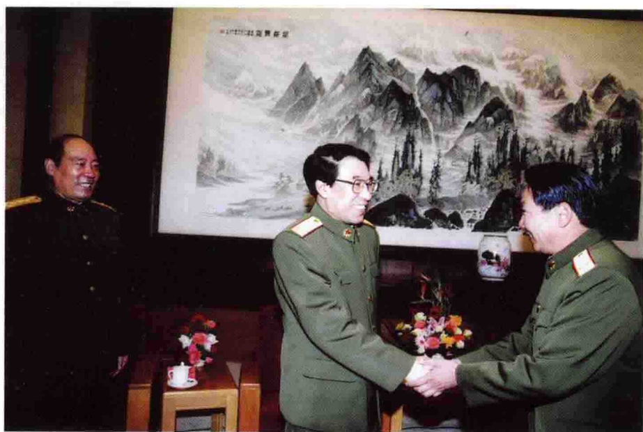
中共中 央书记处书 记、中央军委 副主席徐才 厚，中央军委 委员、总政治 部主任李继 耐等领导接 见李素芝先 进事迹报告 团成员 ◀