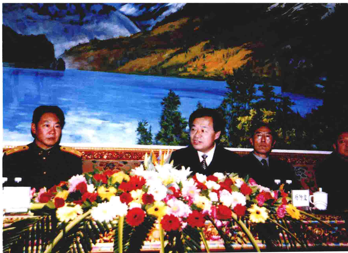
西藏自治区党委书记杨传堂、西藏自治区主席向巴平措等领导接见李素芝先进事迹报告团成员 ▼