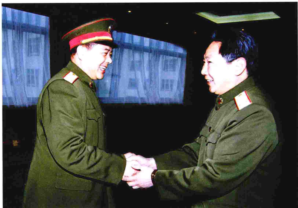
西藏军区司令员董贵山接见李素芝先进事迹报告团成员 ▲