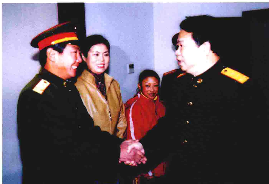
成都军区司令员王建民接见李素芝先进事迹报告团成员 ◀