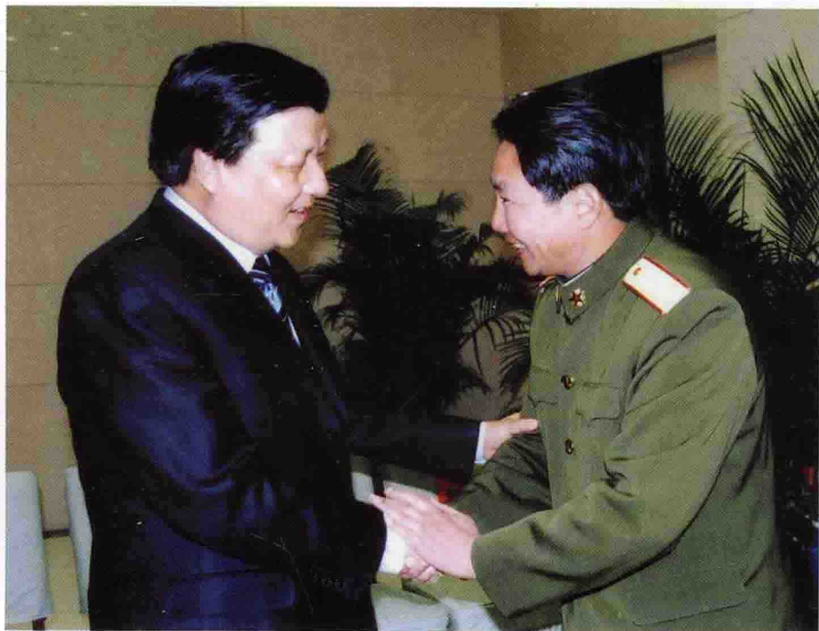
中共中央 政治局委员、 书记处书记、 中宣部部长刘 云山接见李素 芝先进事迹报 告团成员 ◀