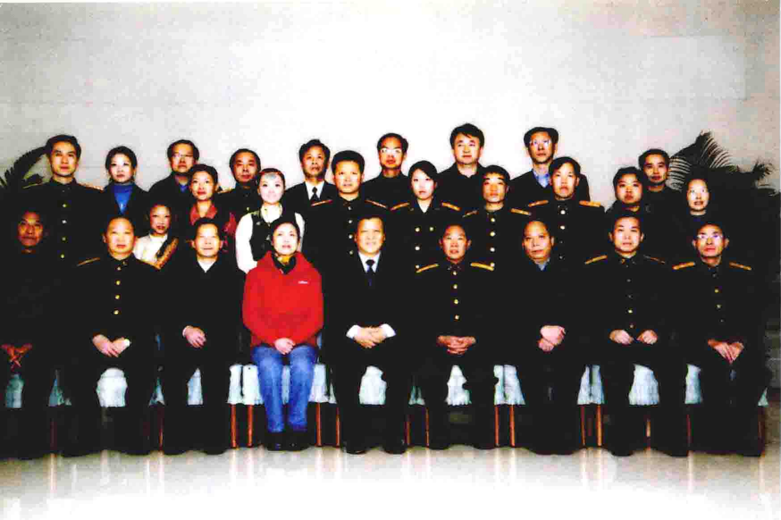
中共中央政治局委员、书记处书记、中宣部部长刘云山与李素芝先进事迹报告团成员合影 ▲