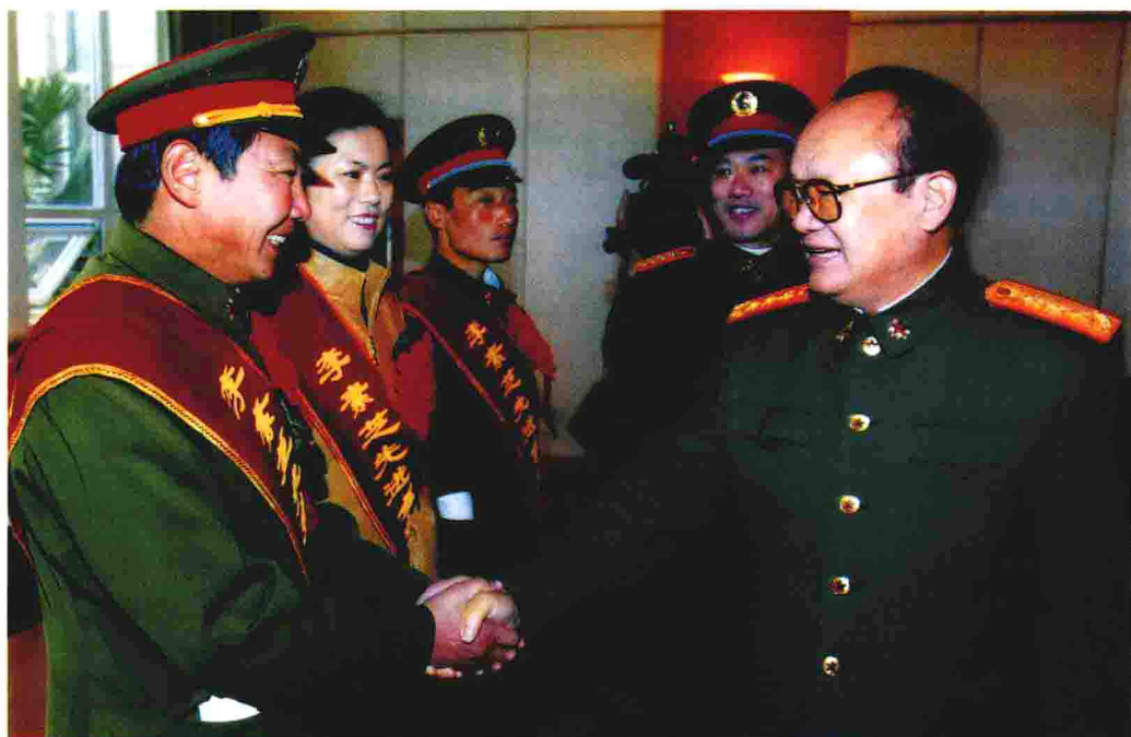
成都军区政治委员刘书田接见李素芝先进事迹报告团成员 ▼