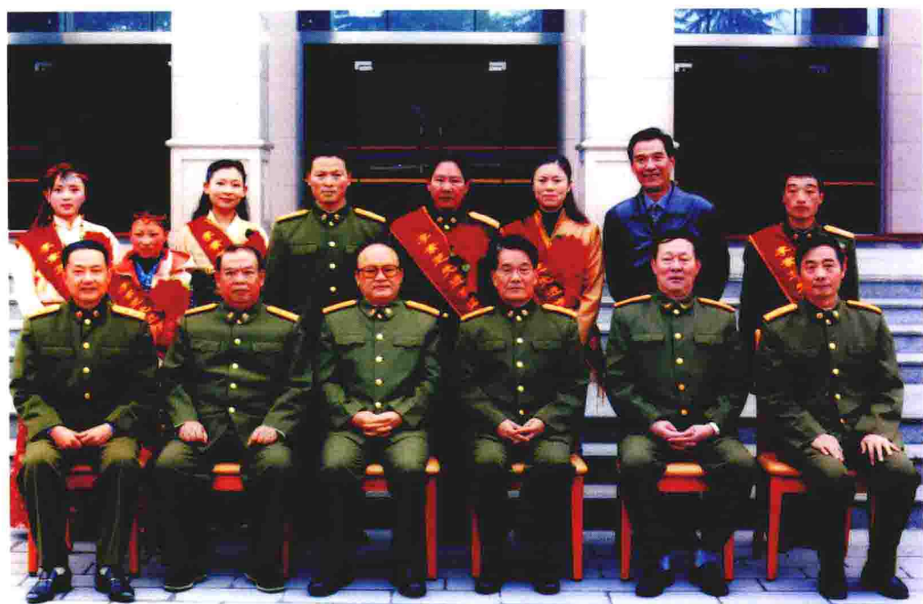
成都军区政治委员刘书田等领导与李素芝先进事迹报告团成员合影 ▲