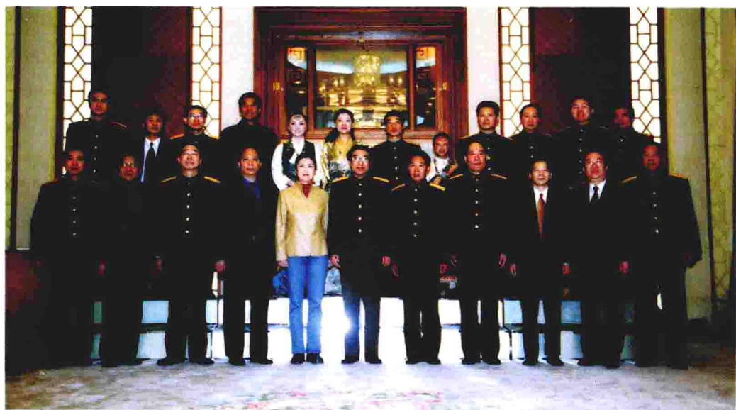
中共中央书记处书记、中央军委副主席徐才厚，中央军委委员、总政治部主任李继耐，中共中央宣传部常务副部长吉炳轩等领导与报告团成员合影 ▲