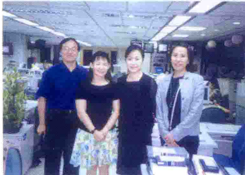
● 2001年任CCTV駐 臺記者期間與 TVBS同行合影