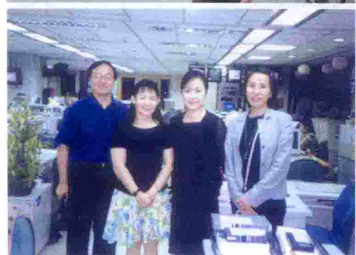
● 2001年任CCTV駐 臺記者期間與 TVBS同行合影