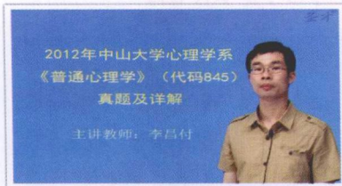
▲ 历年真题名师详解

圣才考研网 (www.100exam.com) —— 成功辅导数万人通关的教育视频网站!