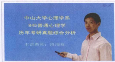
▲ 考研真题综合分析