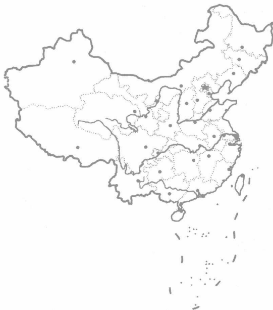
图 1-1 旅游地理区划

东北旅游区： 该区包括黑龙江、吉林、辽宁三省。该区文化历史源远流长，具有丰富的旅游资源，以原始、粗犷、神奇和博大见长。冰河树挂，冰雕雪塑，蔚为奇观；森林、草原广袤富饶以及朝鲜族、满族、蒙古族、回族等少数民族风情民俗吸引着大量中外游客。