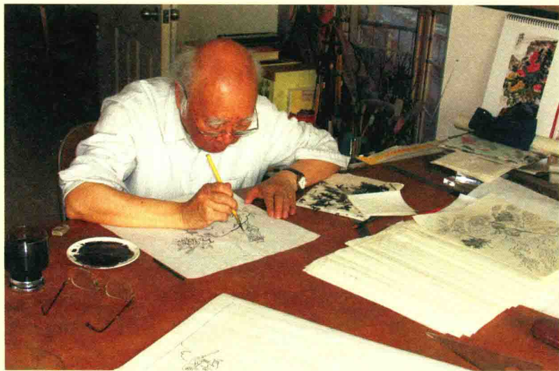
杨永青（1927—2011）， 中国当代著名国画家、连环 画家、版画家和儿童美术教 育家。

杨永青出生在上海浦东一个贫苦农民家庭，种过田，当过学徒，教过书。1952年开始在出版社担任美术编辑，1956年起历任中国少年儿童出版社美术编辑、编审。曾任中国美协儿童艺委会一至十二届的主任。