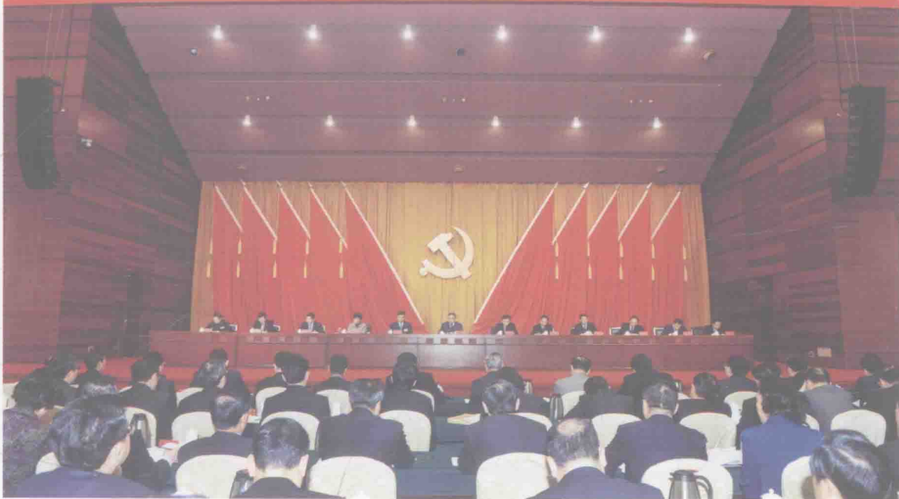
广东省委十一届三次会议