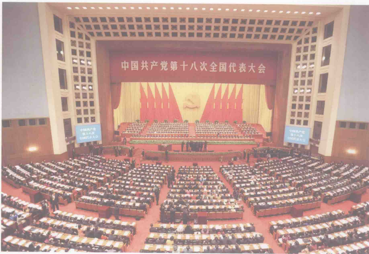
党的十八大提出“建设海洋强国”战略