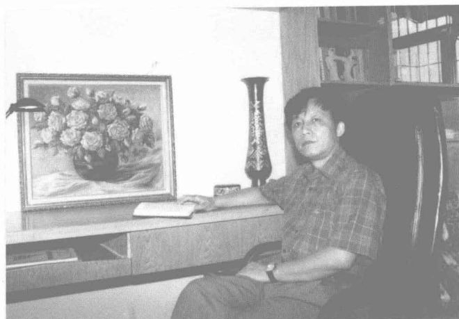
写作《品人录》时在厦门大学凌峰楼