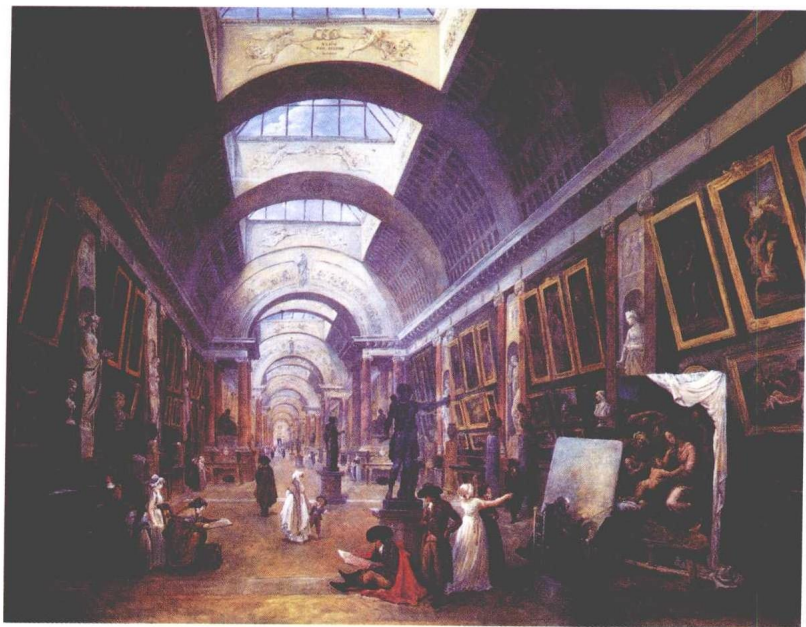
《卢浮宫大画廊内景》| 法国 | 休伯特·罗伯特

巴黎博物院之多，真可算甲于世界。就这一桩儿，便可教你流连忘返。但须徘徊玩索才有味，走马看花是不成的。一个行色匆匆的游客，在这种地方往往无可奈何。博物院以卢浮宫(Louvre)为最大；这是就全世界论，不单就巴黎论……卢浮宫好像一座宝山，蕴藏的东西实在太多，教人不知从那儿说起好。画为最，还有雕刻，古物，装饰美术等等，真是琳琅满目。乍进去的人一时摸不着头脑，往往弄得糊里糊涂。