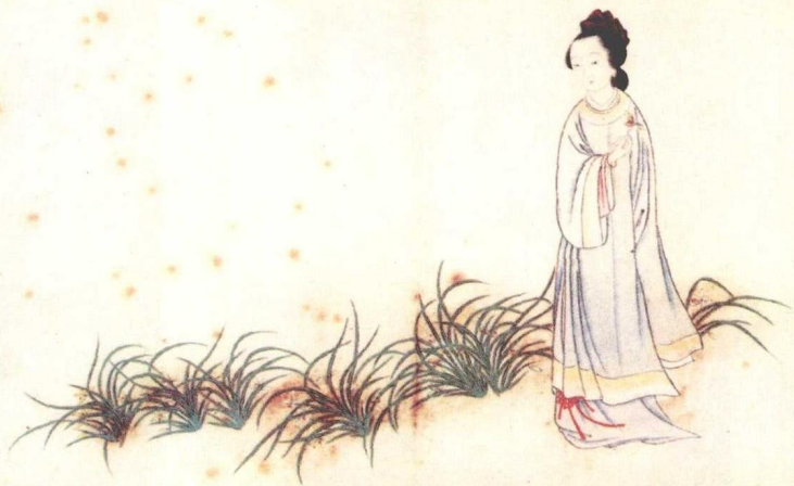
《美人香草》| 清代 | 高柱立

我以为艺术的女人第一是有她的温柔的空气，使人如听着萧管的悠扬，如嗅着玫瑰花的芬芳，如躺在天鹅绒的厚毯上。她是如水的密，如烟的轻，笼罩着我们；我们怎能不欢喜赞叹呢？这是由她的动作而来的，她的一举步，一伸腰，一掠鬓，一转眼，一低头，乃至衣袂的飘扬，裙幅的轻舞，都如蜜的流，风的微漾；我们怎能不欢喜赞叹呢？最可爱的是那软软的腰儿，从前人说临风的垂柳，《红楼梦》里说晴雯的“水蛇腰儿”，都是说腰肢的细软的；但我所欢喜的腰呀，简直和苏州的牛皮糖一样，使我满舌头的甜，满牙齿的软呀。腰是这般软了，手足自也有飘逸不凡之概。