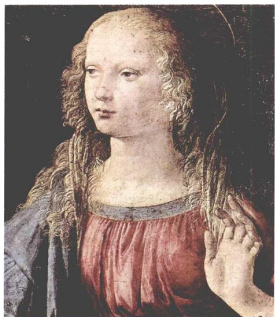
《送子图》及局部 | 意大利 | 达·芬奇