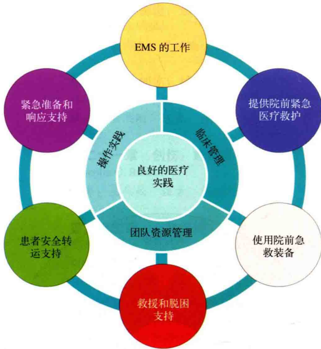
图 1.2 院前紧急医疗课程主题